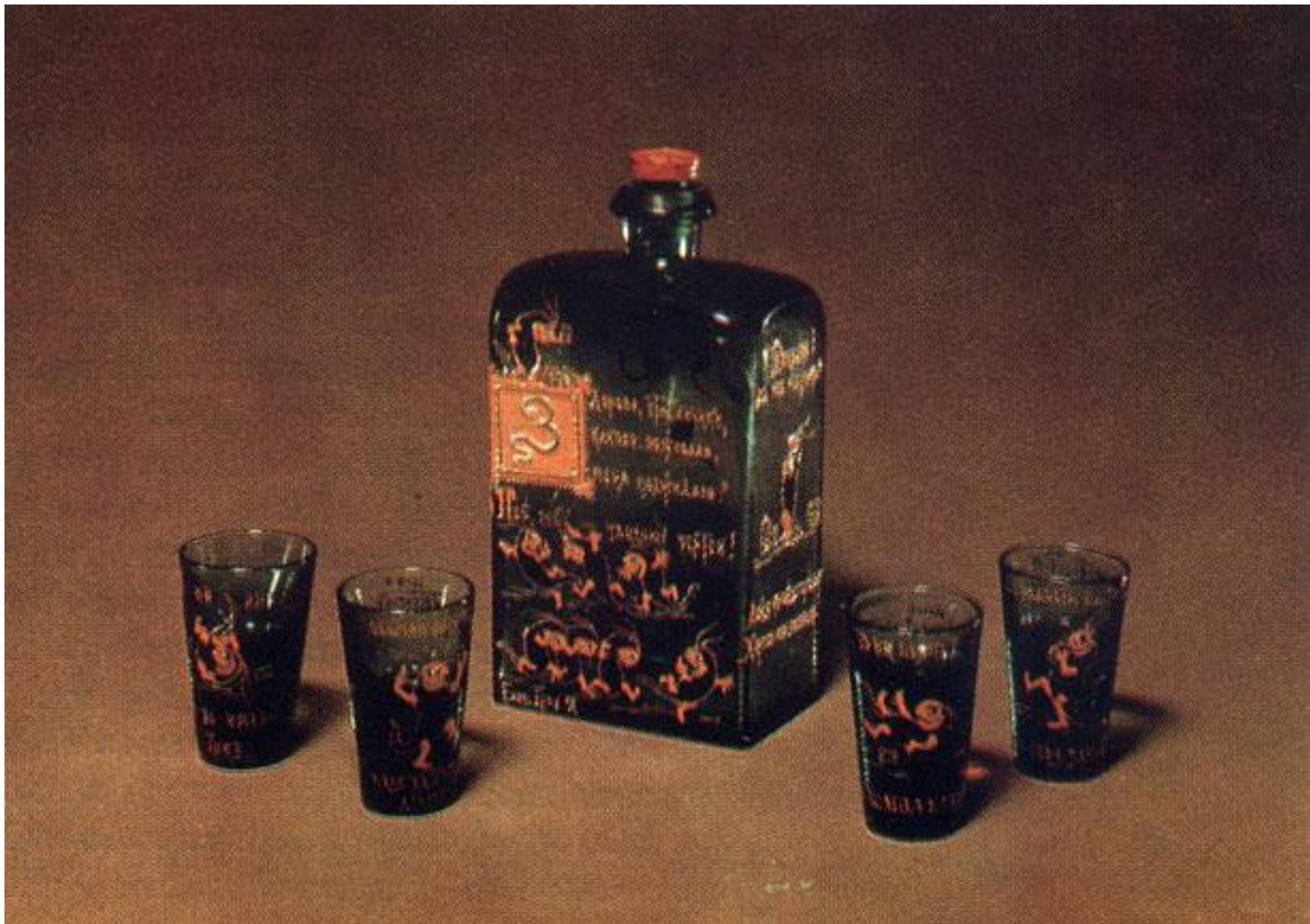
Е. Бем. Набор для вина. Цв. стекло, эмаль. 1897