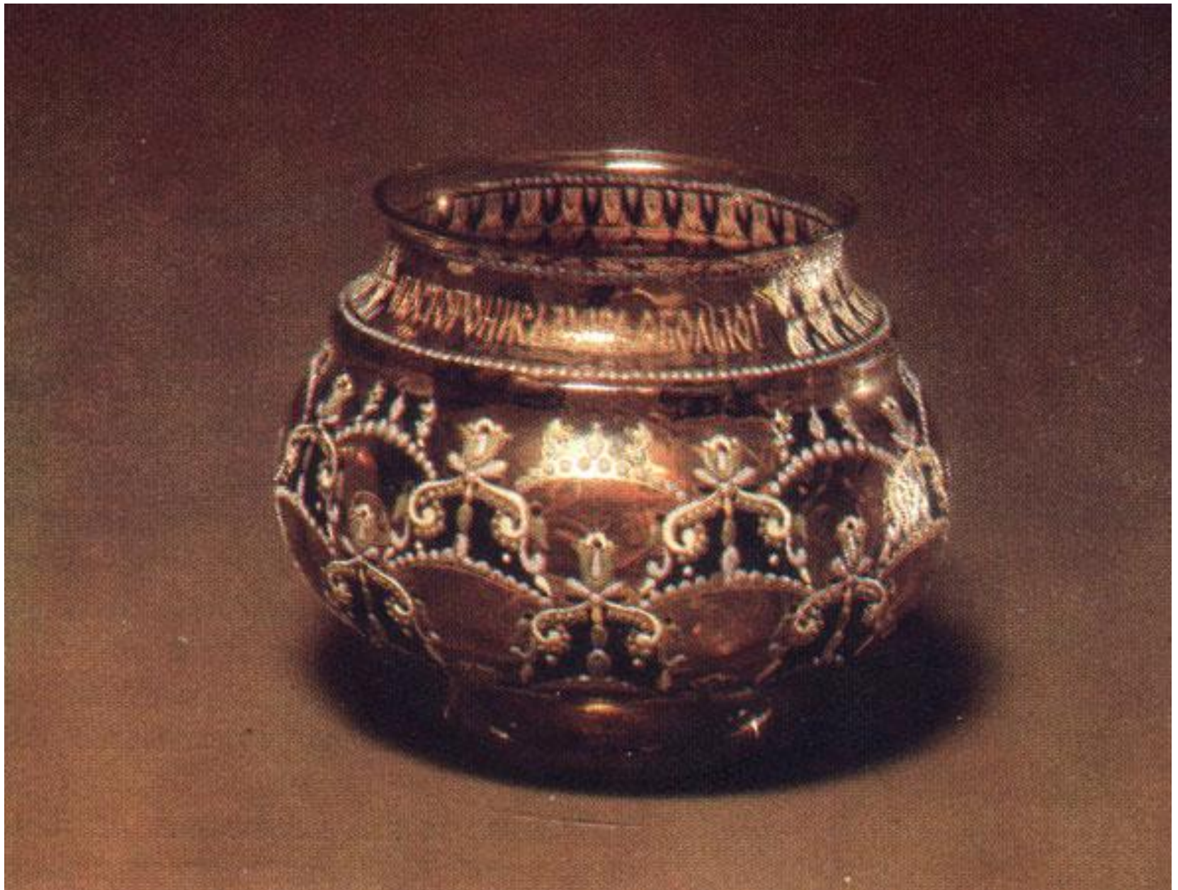
Е. Бем. Братина. Цв. стекло, эмали. Конец XIX в.