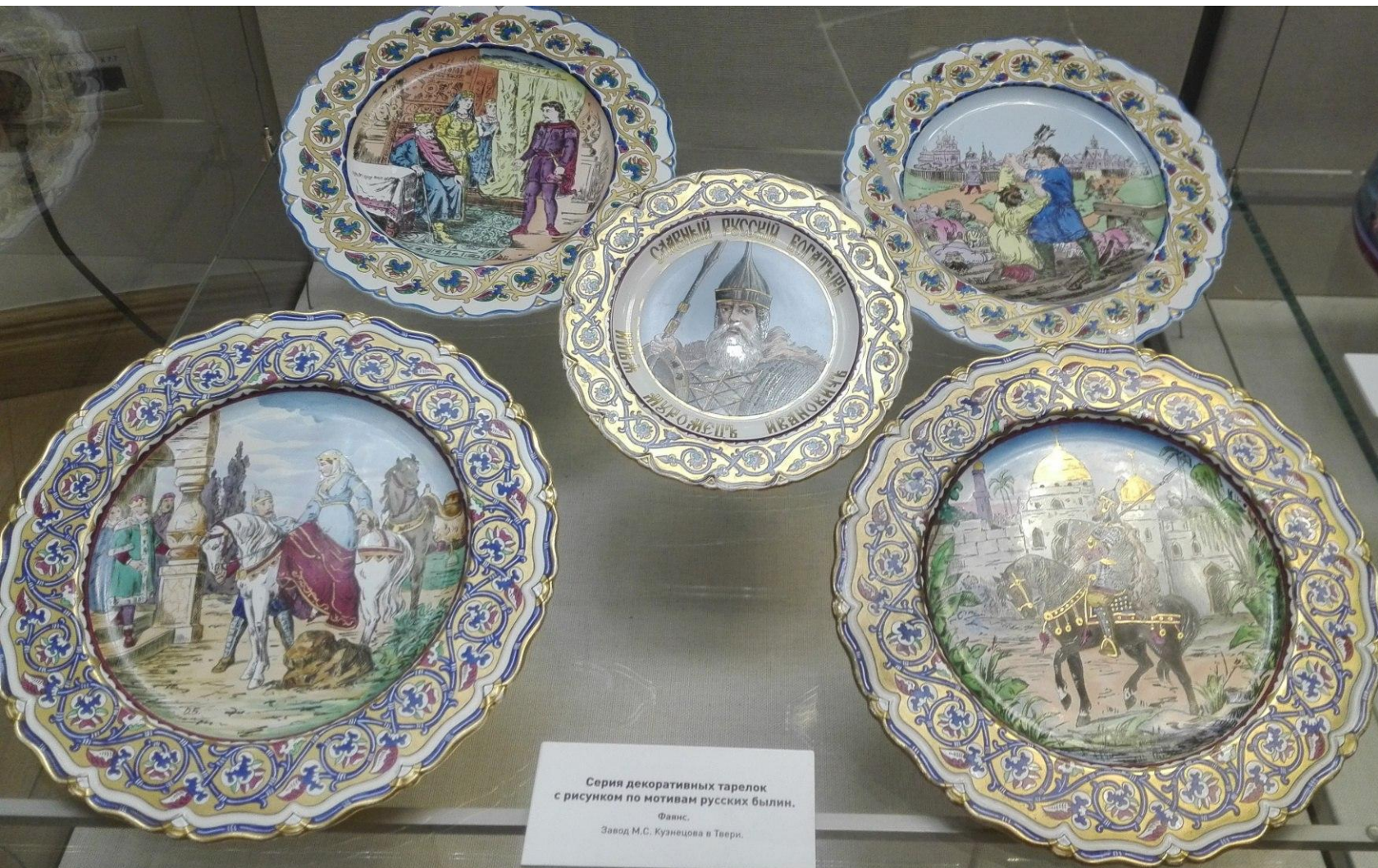
Серия декоративных тарелок с рисунком по мотивам русских былин. Фаянс, Завод М.С. Кузнецова в Тавери.