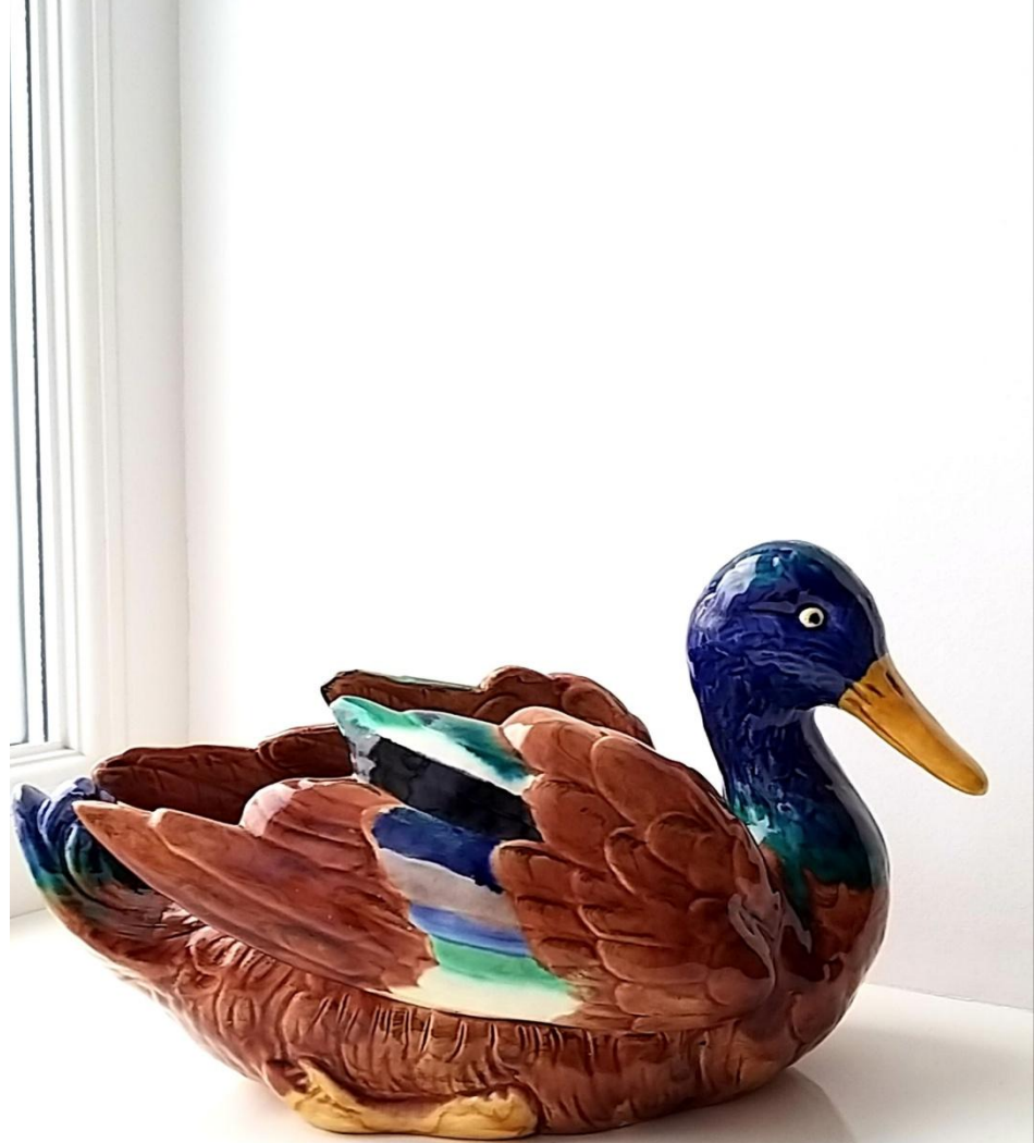
Ваза статуэтка "Утка селезень" - М.С.Кузнецова