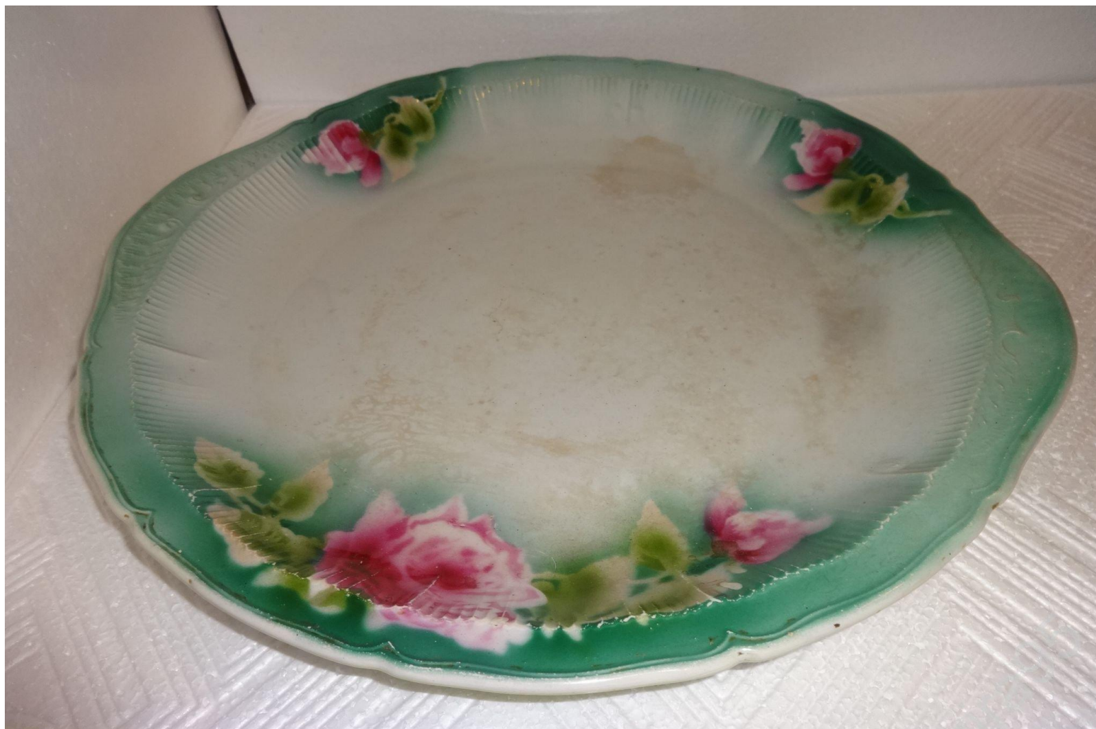
Большое блюдо с розами. Песоченская фабрика Государственные Мальцовские заводы.