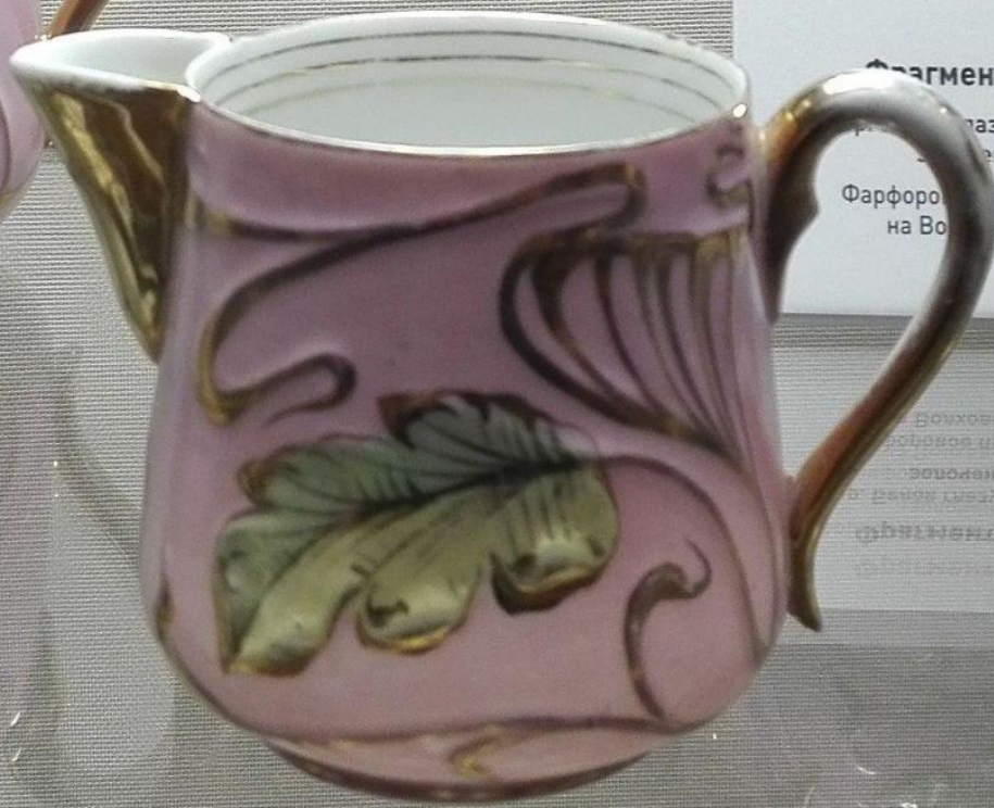
Фрагмент чайного сервиза ...лазурь, розовое и кремовое ...ение ручек и носиков. Фарфоровое производство И.Е.Кузнецова на Волге (Грузинская фабрика)