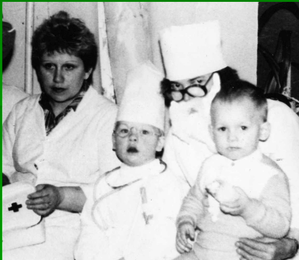
Новогодний утренник Для детей мед. работников .

Все жизненные испытания моя прабабушка прошла достойно. О ней вспоминают с уважением, но самое главное с добротой в сердце. Ее доброе сердце и сострадание к людям постоянно стремились совершать добрые поступки даже в суровые времена. Ее доброта – величайший героизм, который был вознагражден. Мою прабабушку много раз награждали. Есть у неё медаль "За доблестный труд", "Ветеран труда", много грамот.