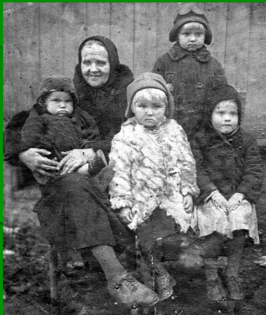
Лиля с бабушкой