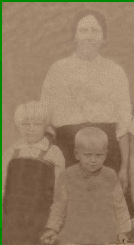
Лиля со своей мамой и братом