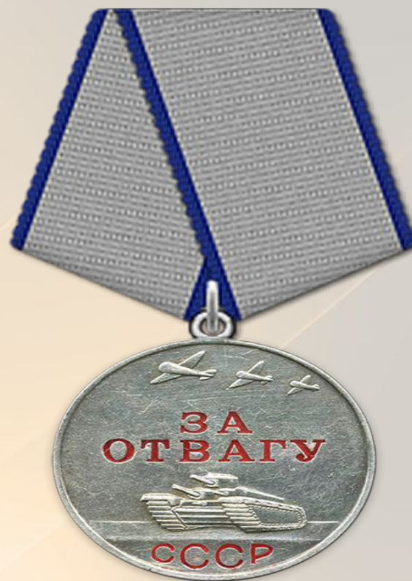
17.09.1944 года В звании рядовой награжден медалью «За Отвагу»