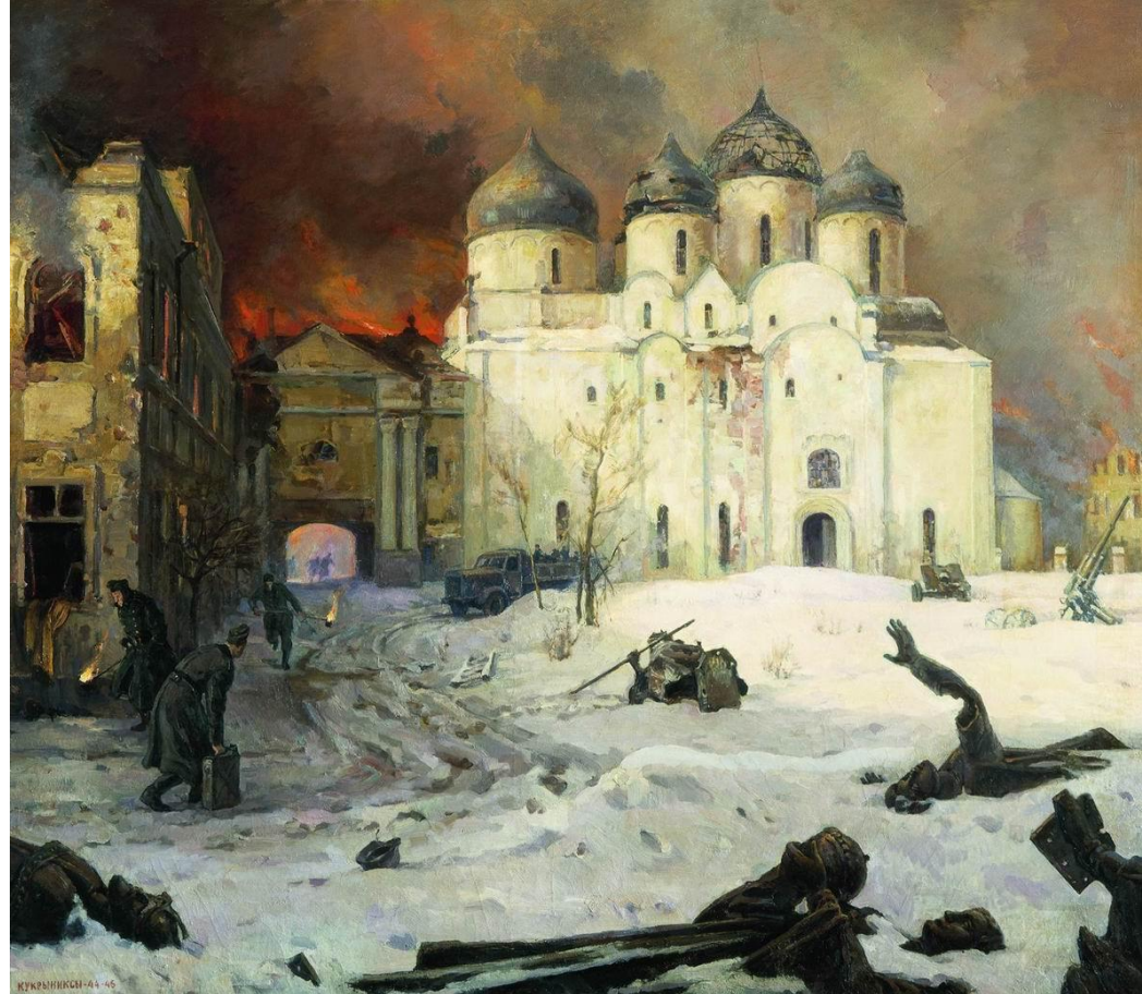
«Бегство фашистов из Новгорода» 1944