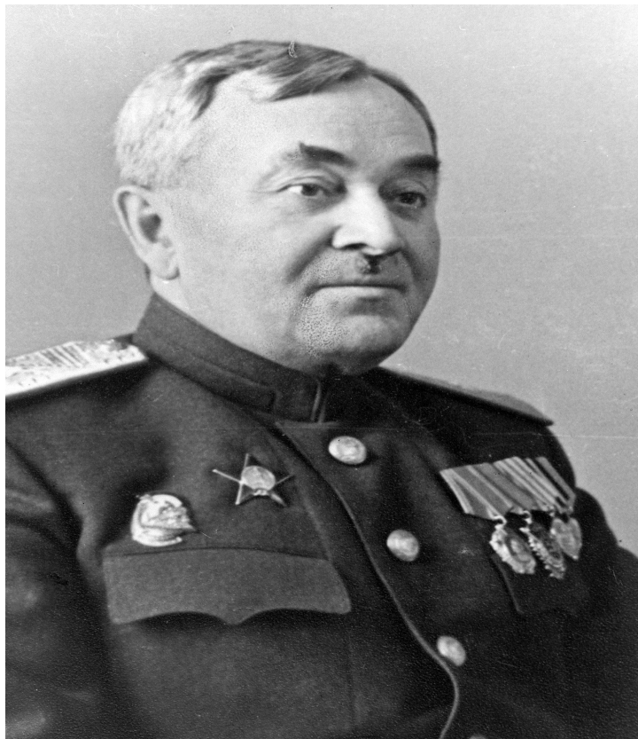
Композитор Александр Александров