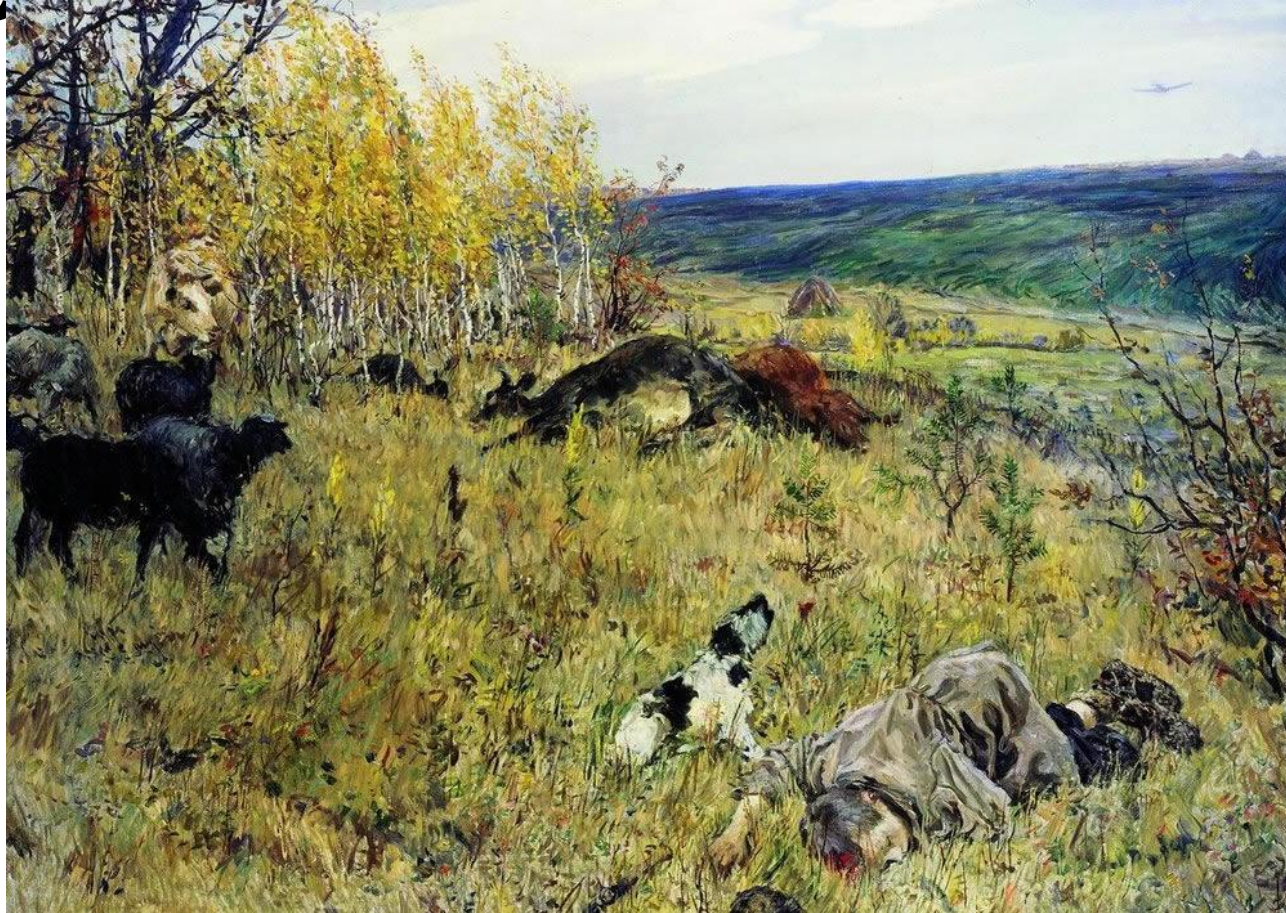
«Фашист пролетел» (1942)