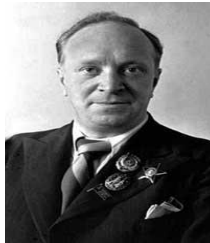
Автор слов Василий Лебедив- Кумач