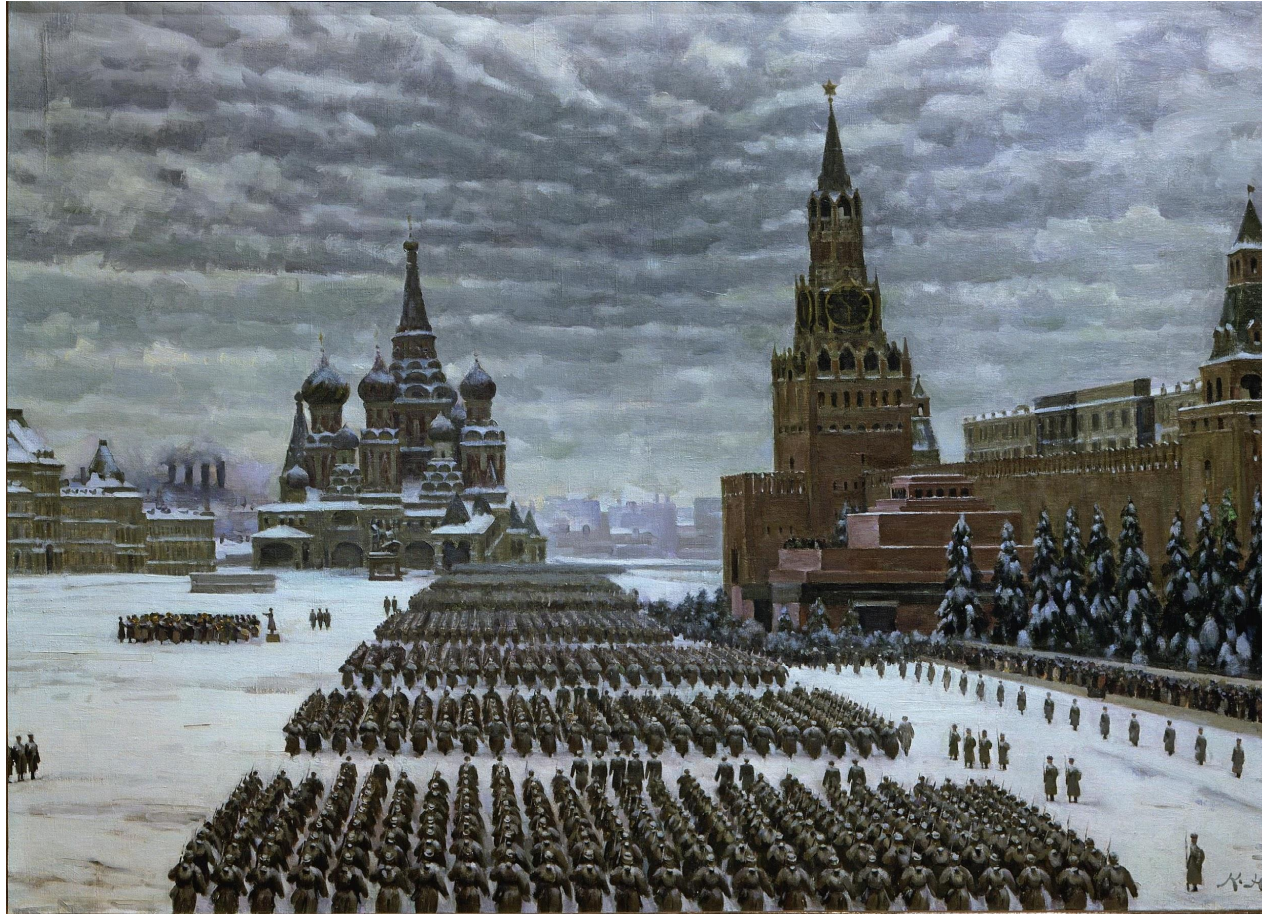
Константи́н Фёдорович Юо́н «Парад на Красной площади 7 ноября 1941 года» (1942)