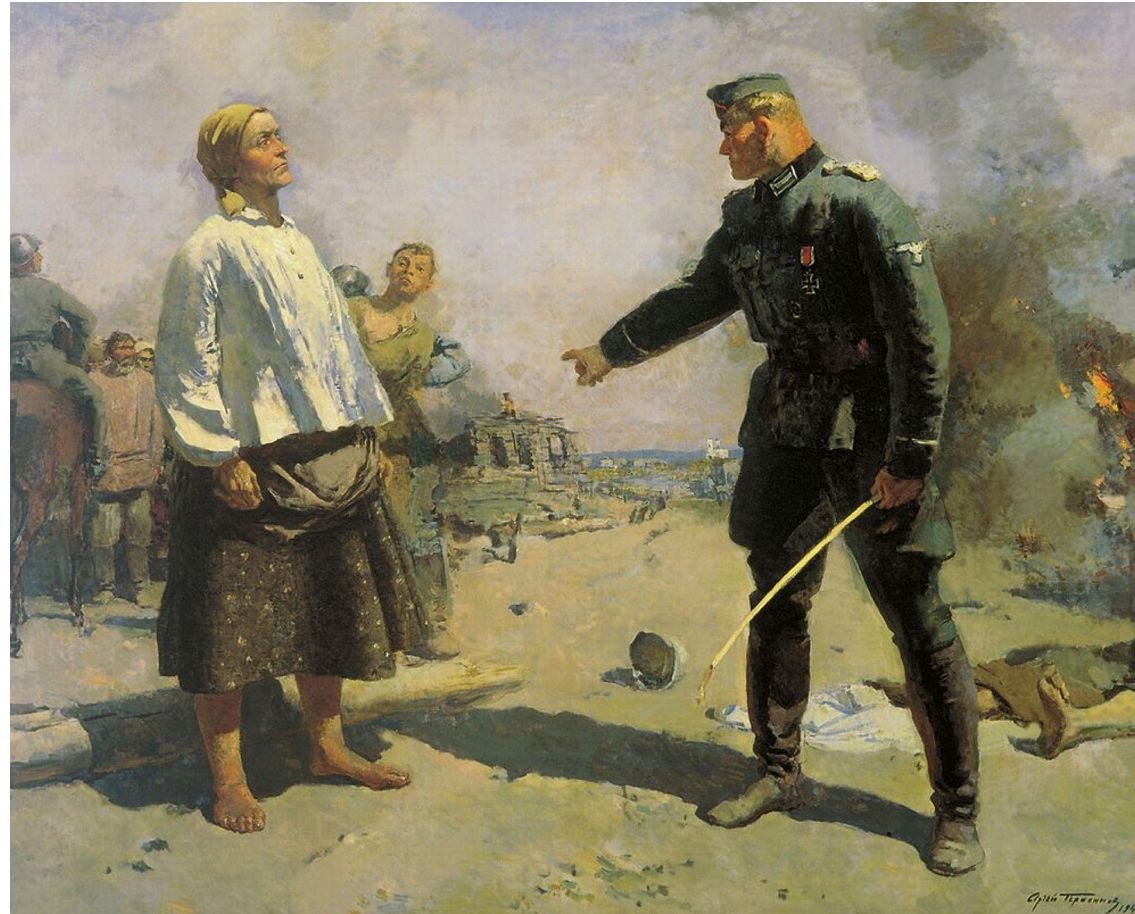
«Мать партизана» (1943)