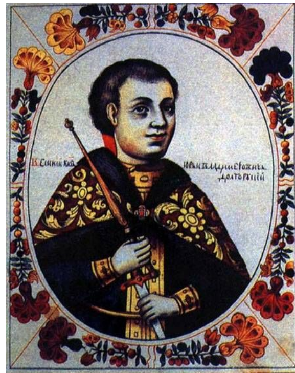
Основатель города - Юрий Долгорукий