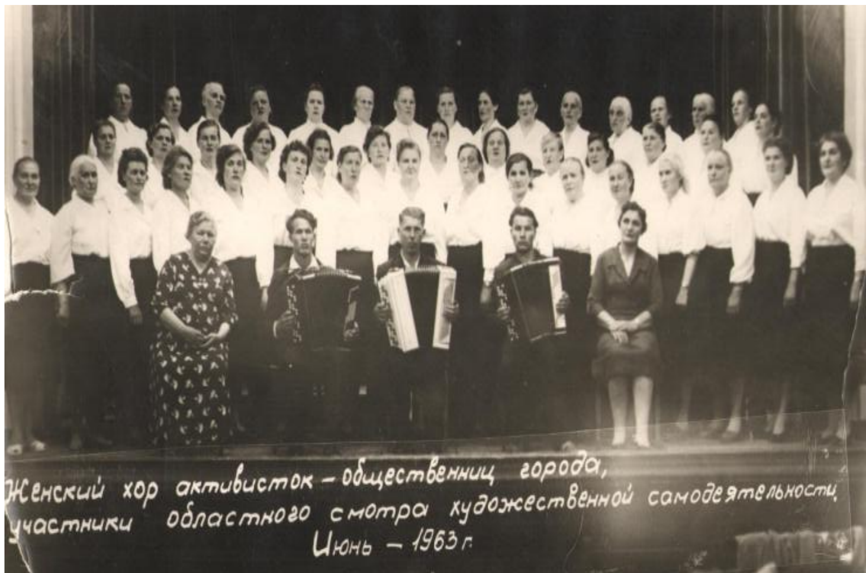
Женский хор активисток — общественниц города, участники областного смотра художественной самодеятельности, Июнь — 1963 г.