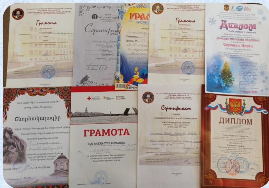
Достижения Симоняна Нарека