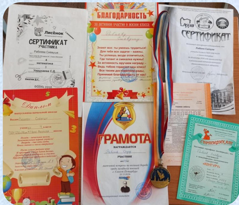
Достижения Рабиева Сиевуша