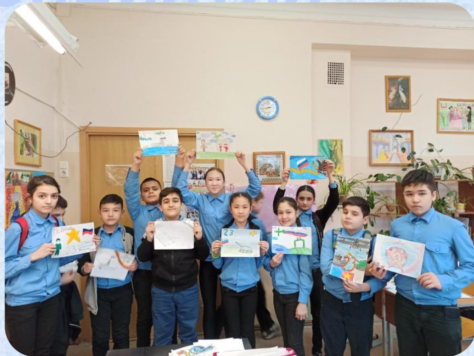
Конкурс рисунков, посвященный Дню Защитников Отечества «Я честью этой дорожу»