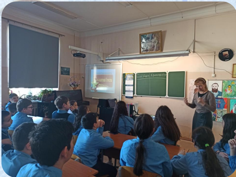
Викторина, посвященная Дню Защитнику Отечества