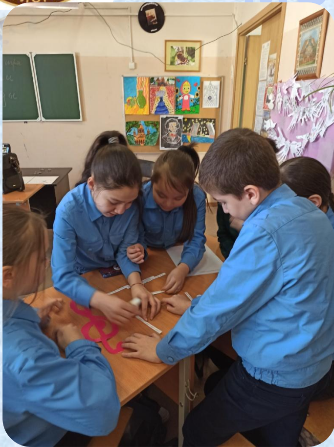
Музыкальная игра «Песни Победы»