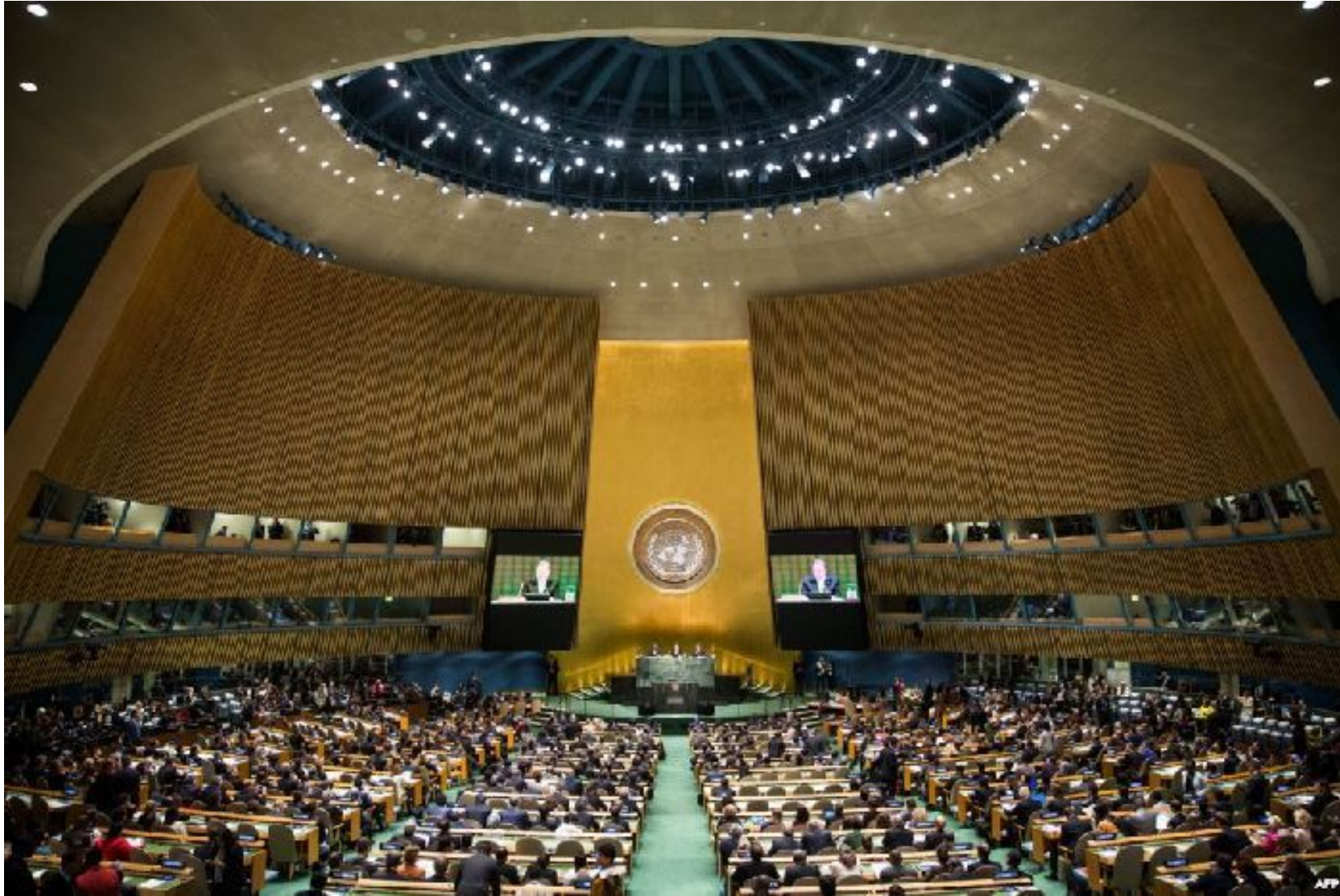
Генеральная Ассамблея ООН