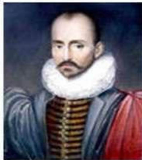
Мишель Де Монтень