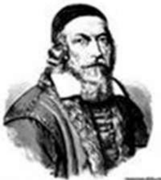
Ян Амос Коменский