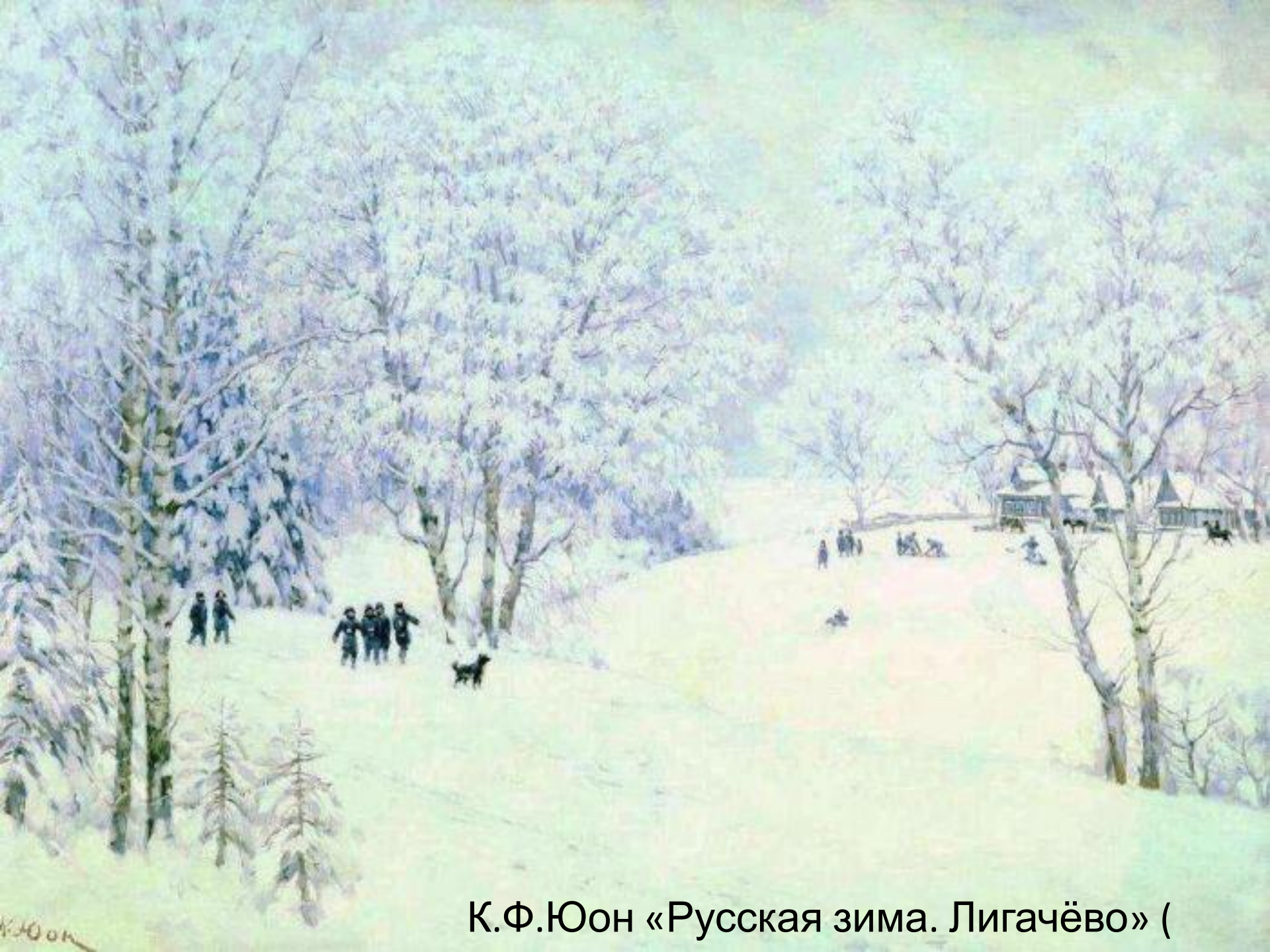
К.Ф.Юон «Русская зима. Лигачёво» (