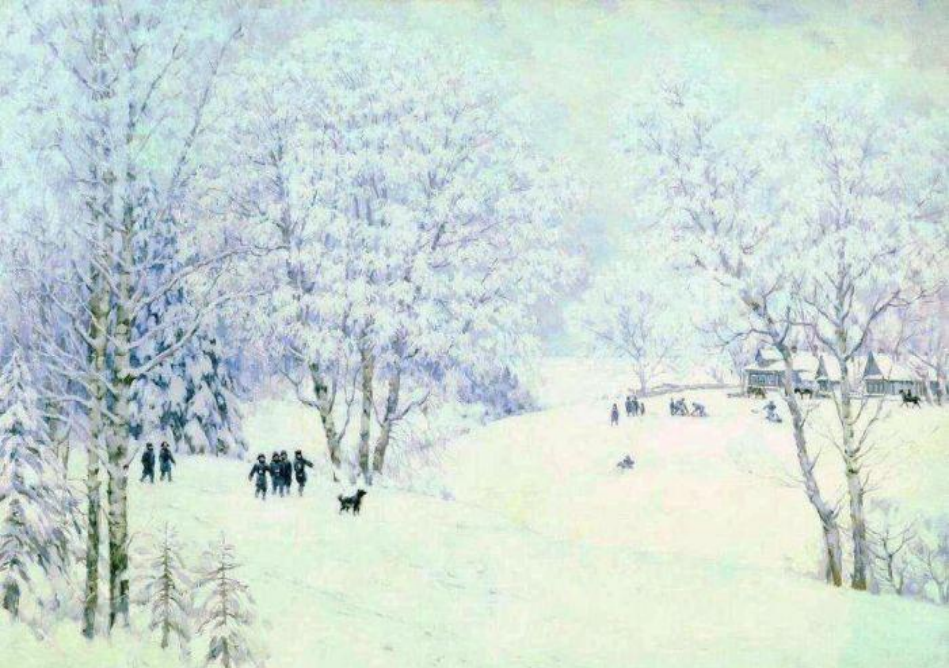
К.Ф.Юон «Русская зима. Лигачёво» (