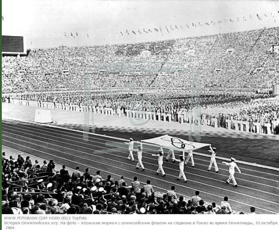
HD00-0012 История Олимпийских игр. На фото - японские моряки с олимпийским флагом на стадионе в Токио во время Олимпиады, 10 октября 1964.

В 1964 г. в Токио состоялся первый Олимпийский турнир по волейболу с участием 10 мужских и 6 женских команд, это было огромным достижением волейбола. Советская мужская и японская женская команды завоевали первые Олимпийские золотые медали.