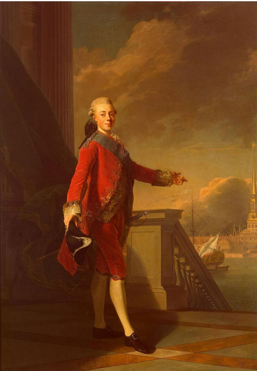
А. Рослин. Портрет великого князя Павла Петровича. 1777 г