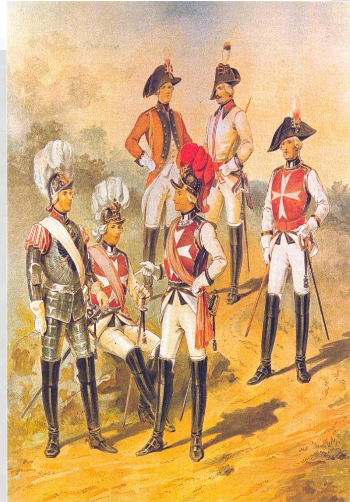
Кавалергарды в царствование Павла I