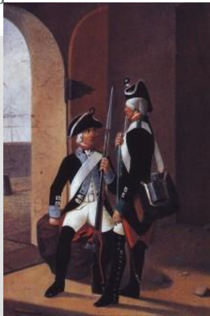
Мушкетеры Петербургского и Московского гарнизонов.