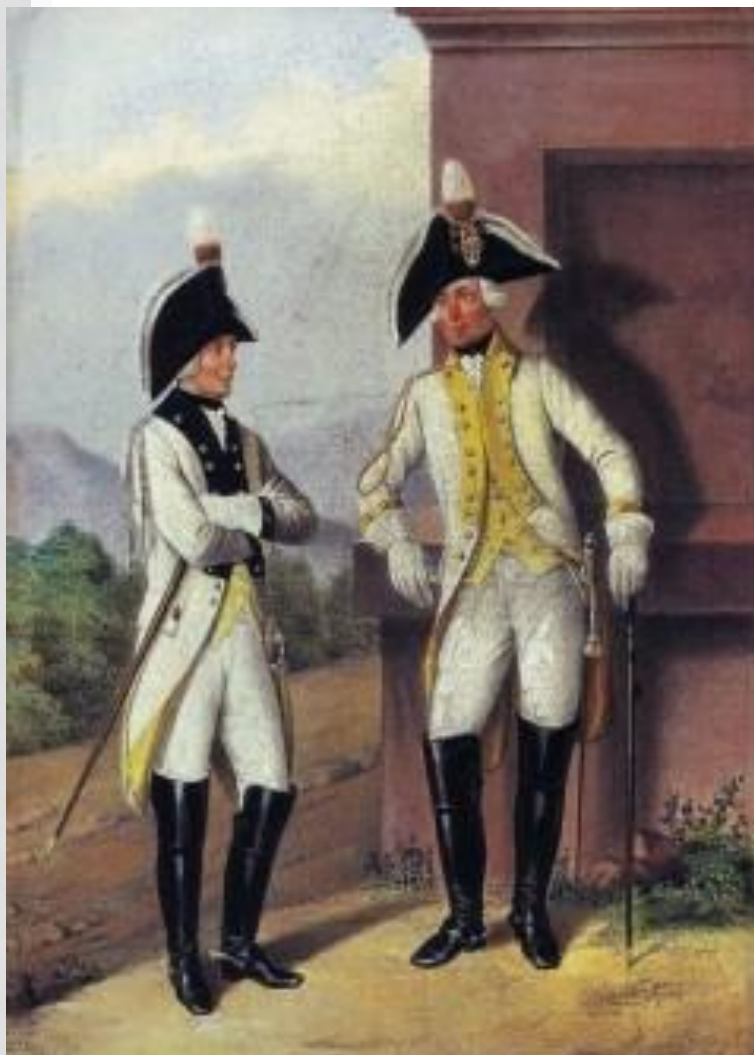
Генералы Харьковского и Малороссийского полка в виц-мундирах.