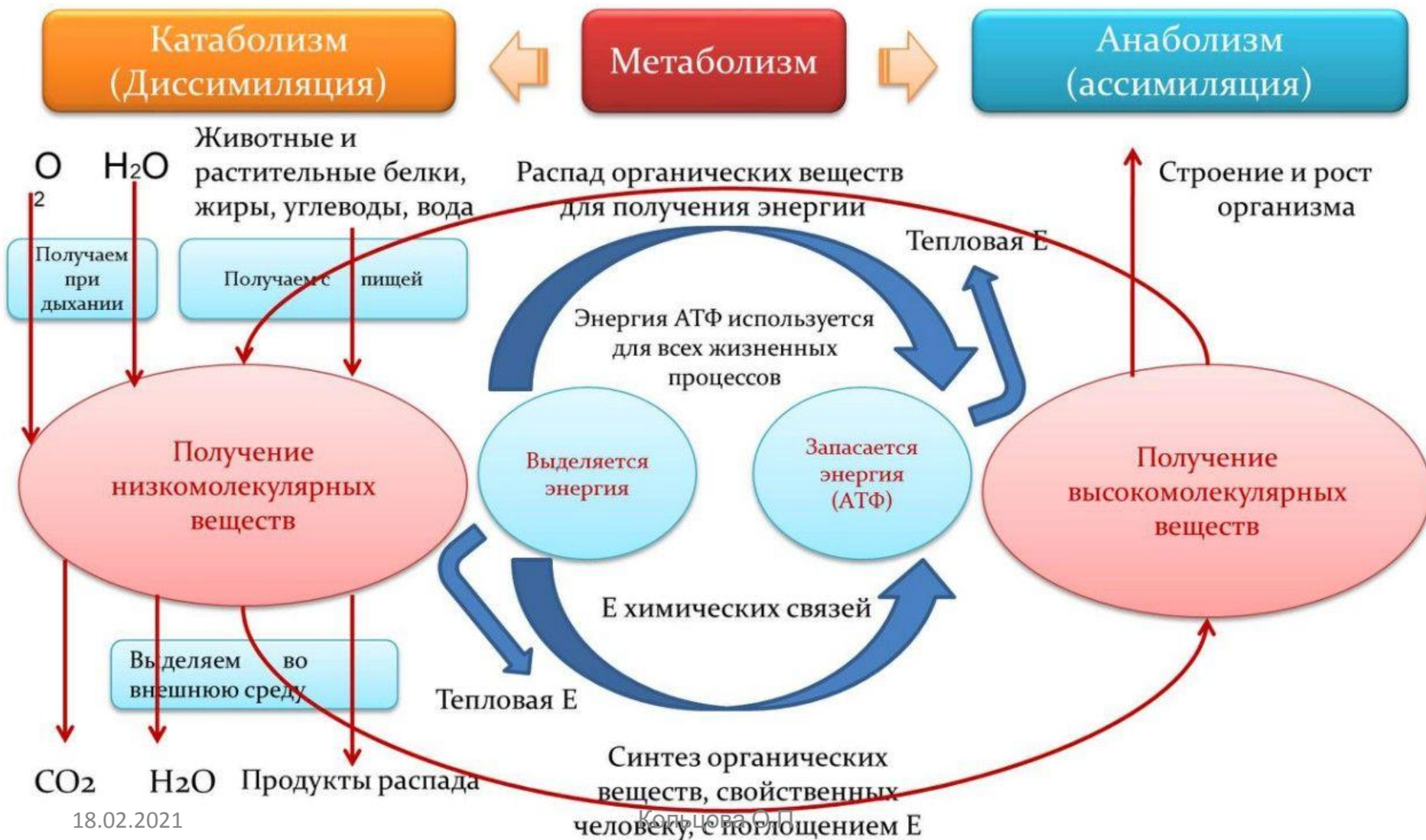
Схема обмена веществ