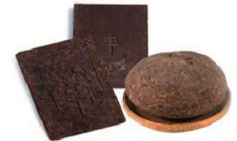
Кирпичный чай (Монголия)