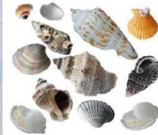
Морские ракушки (Южной Америки на островах Океании)