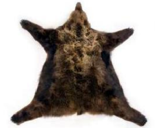
Шкуры зверей (Канада, Россия)