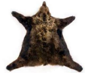
Шкуры зверей (Канада, Россия)