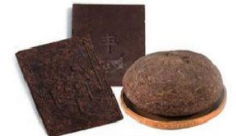
Кирпичный чай (Монголия)