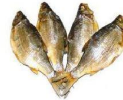
Сушеная рыба (Исландия)

* Эквивалент-равноценный, равнозначный продукт (товар-посредник), используемый в обмене на другие товары.