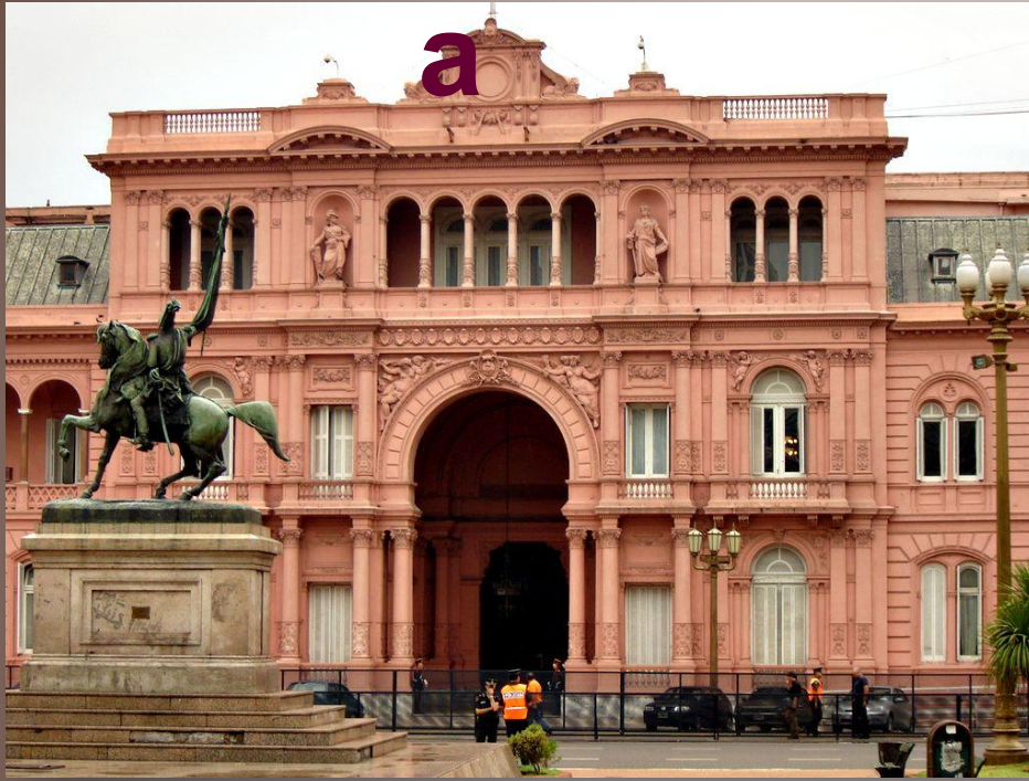
Президентский дворец Каса-Росада (Розовый дом) в Буэнос-Айресе