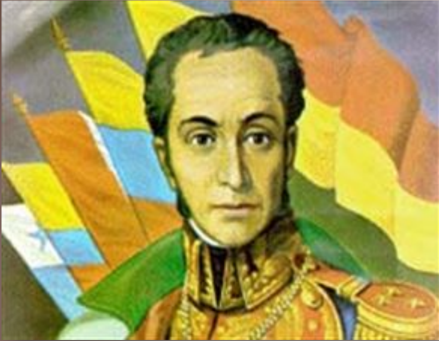
Симон Боливар Венесуэла