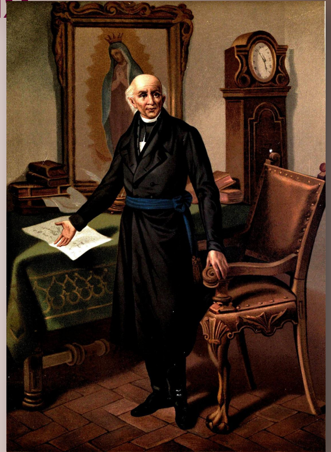
Мигель Идальго Мексика