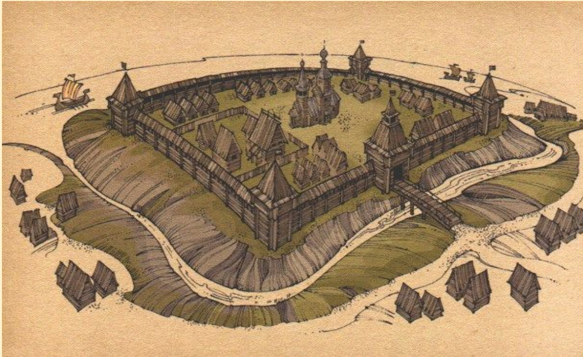
Рисунок 1 - Тула в первые столетия своего существования