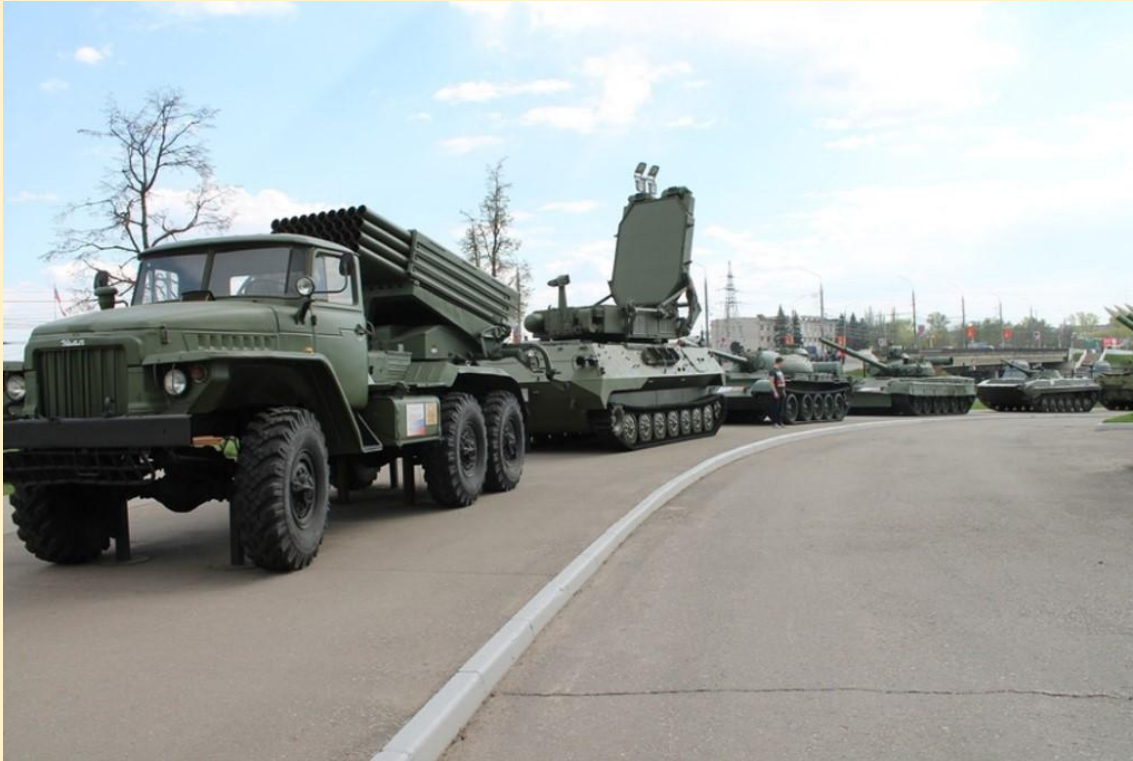
Рисунок 10 - экспонаты с выставки