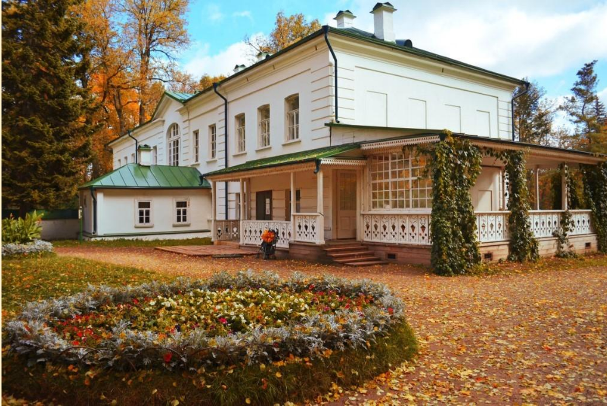
Рисунок 7 - Дом-музей Л.Н.Толстого