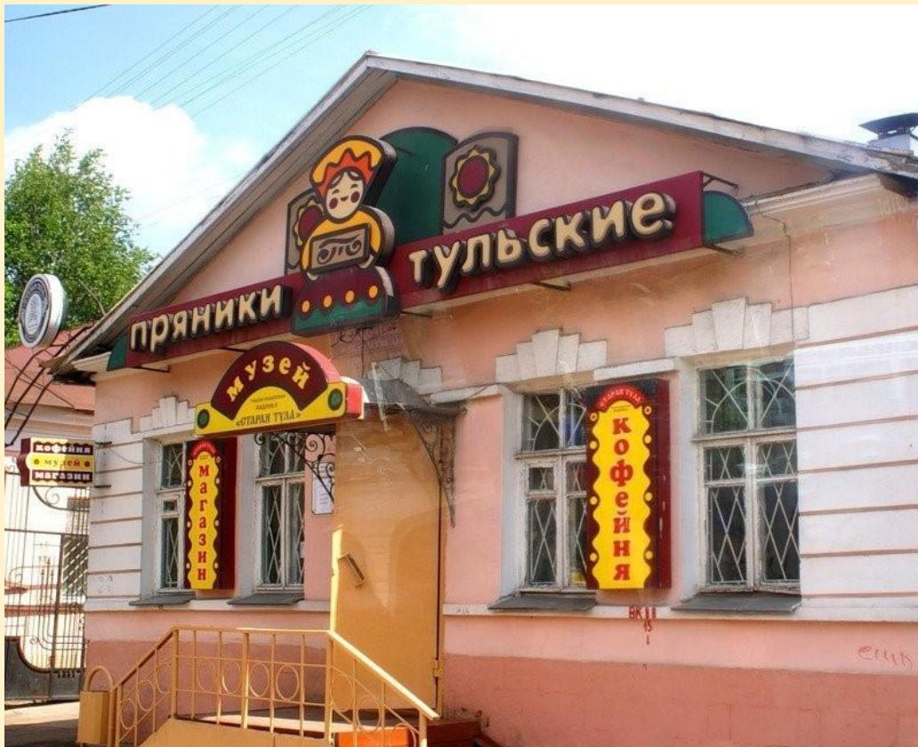
Рисунок 13 - Музей "Тульский пряник"