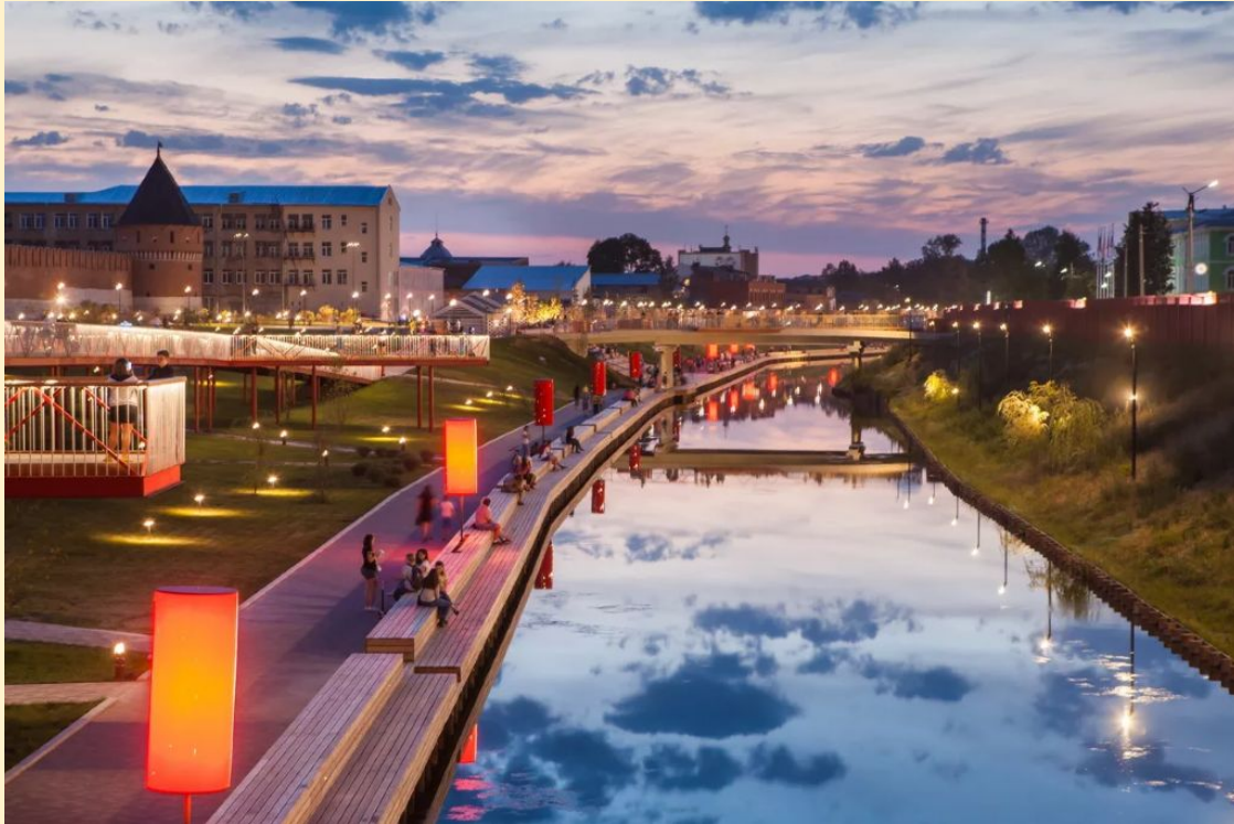
Рисунок 11 - Казанская набережная