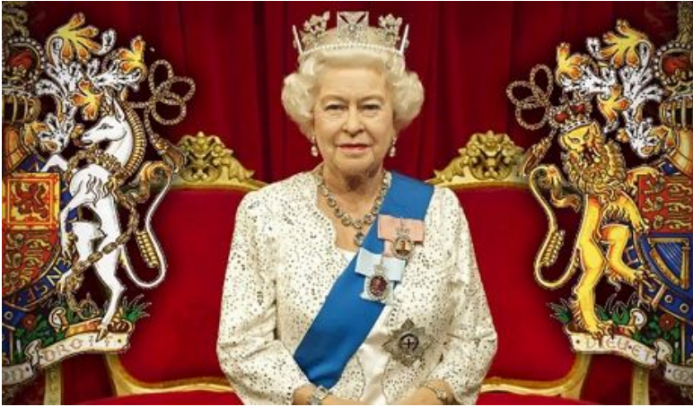
Королева Великобритании - Елизавета II