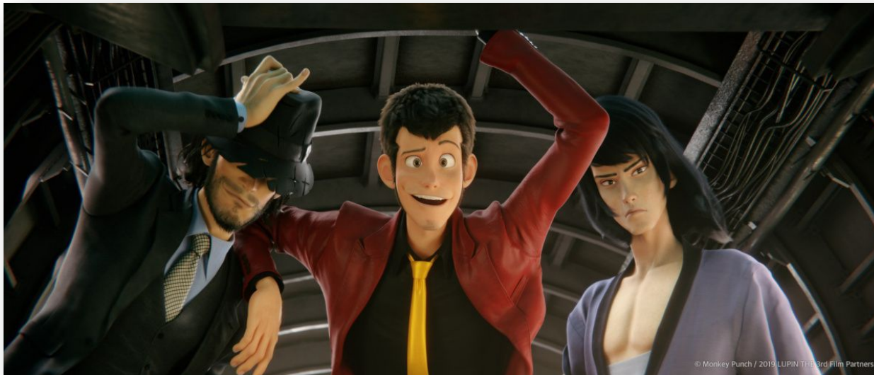
Основное трио. Кадр из «Люпен III: Первый» (2019)

Арсен Люпен Первый в воспоминаниях внука