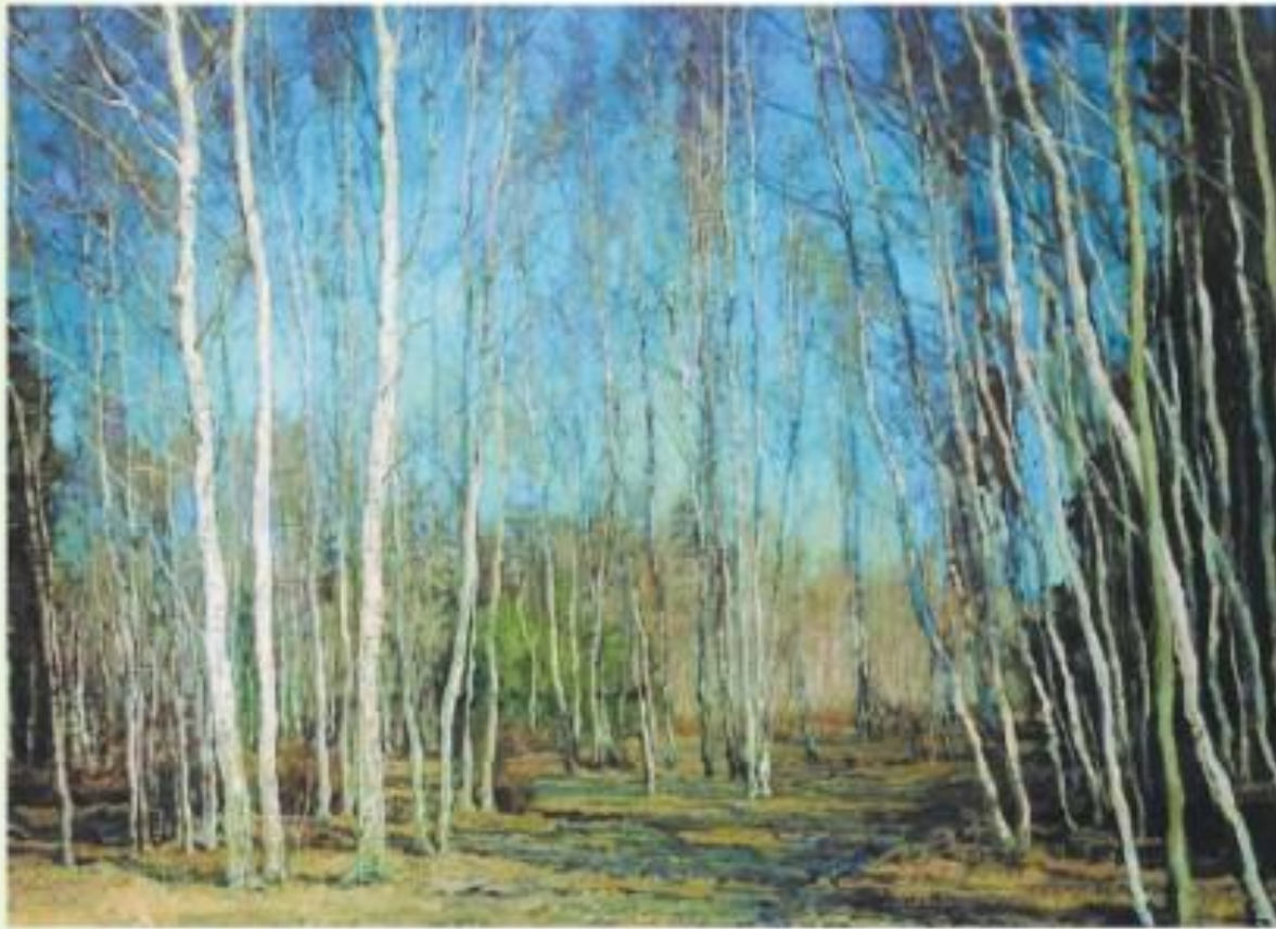
В. Бакшеев. Голубая весна. Масло

На картине В. Бакшеева — нежность ласкового утра. Весенние берёзы похожи на струны. Они тянутся вверх, а их ветви создают узоры на фоне неба.