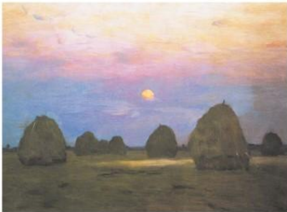
И. Левитан. Стога. Сумерки. Масло