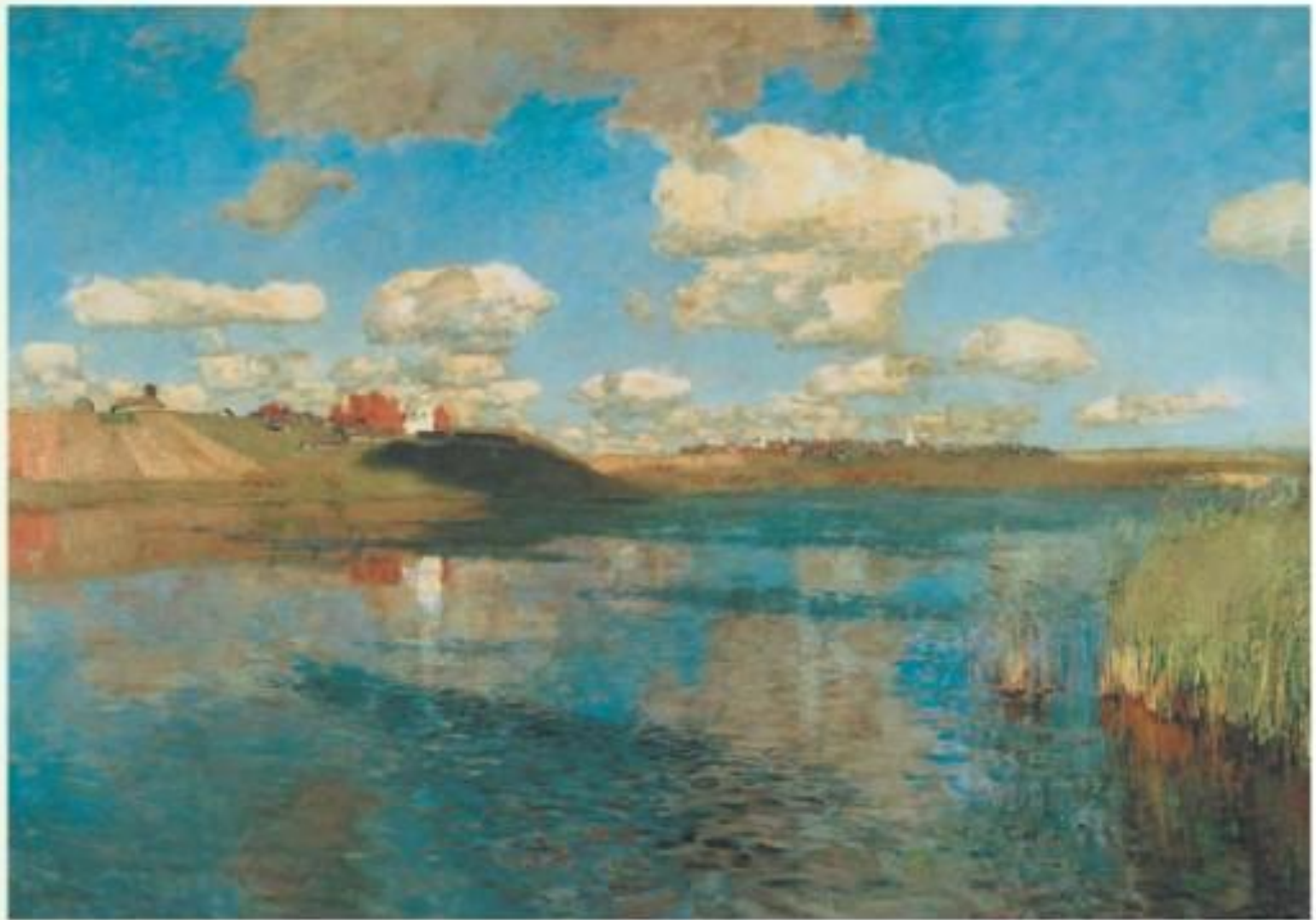
И. Левитан. Озеро. Русь. Масло