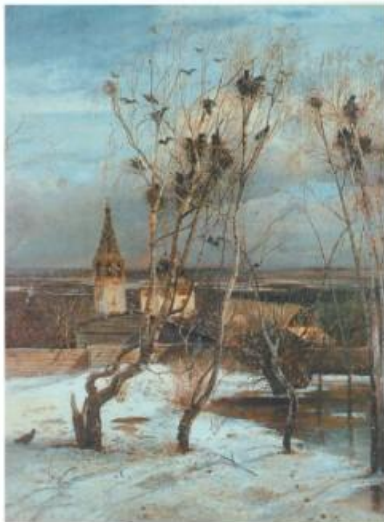
А. Саврасов. Грачи прилетели. Масло