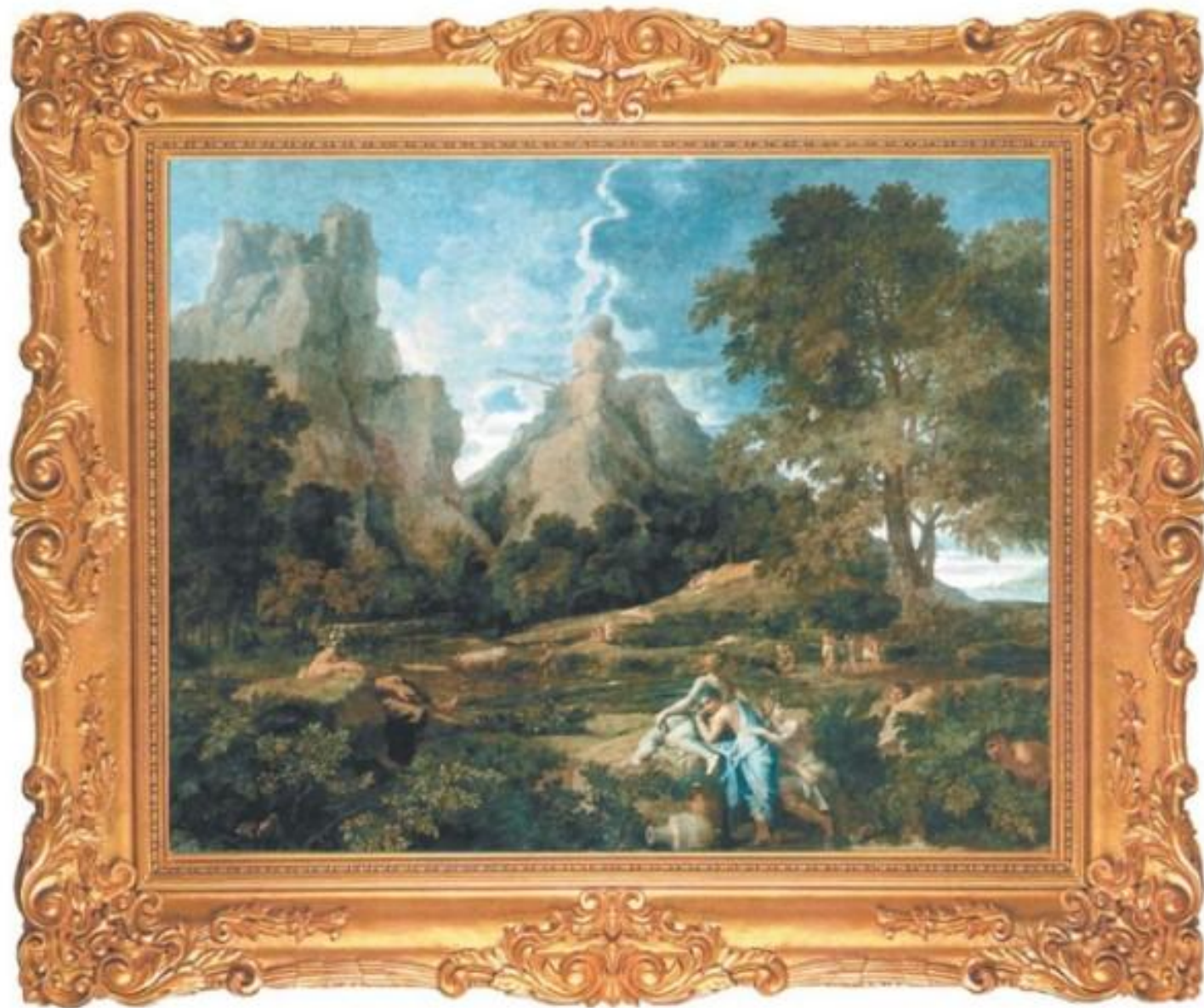
Н.Пуссен «Пейзаж с Полифемом» масло