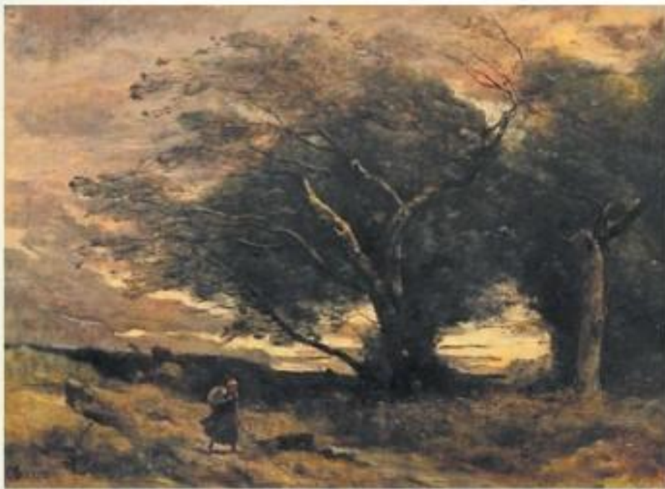
К. Корó. Порыв ветра. Масло

А на картине французского художника К. Кору изображено начало грозы. Потемнело, мощный порыв ветра. Одиноко и страшно тому, кто в пути. Но велика сила могучих деревьев-великанов. И свет в небе — точно блеск непокорного взгляда! В природе буря, но художник передал зрителю своё чувство бодрости и весёлой отваги.