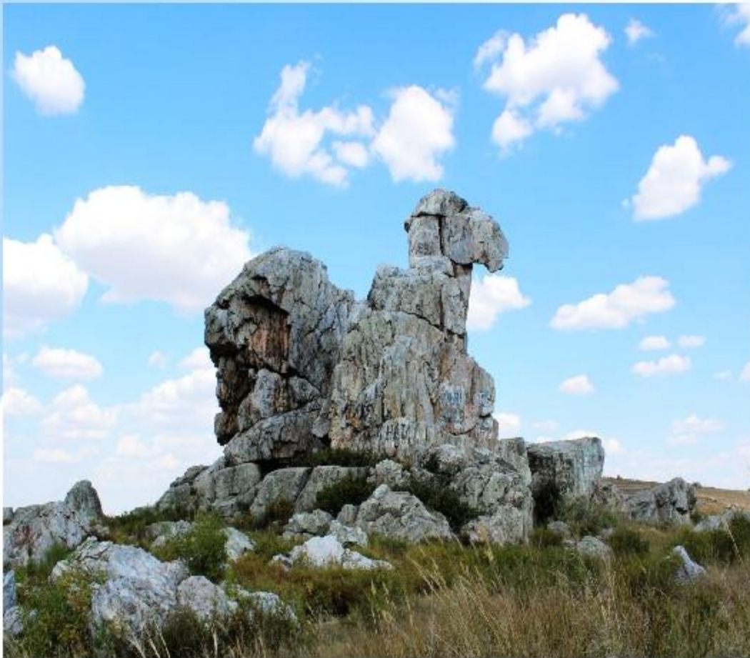
Верблюд-гора находится в Светлинском районе Оренбургской области

Давным-давно в этих местах проходил караван кочевников. Люди искали плодородные земли, где можно было бы спокойно жить и в достатке растить детей. Шли они долго, но вокруг были только степи. От жары и нехватки воды люди и скот падали замертво. В конце концов остался только один, самый упрямый, верблюд. Он продолжал идти, несмотря на усталость и жажду, пока наконец не увидел вдалеке голубую ленту реки. Верблюд вздохнул с облегчением, прилёг, чтобы отдохнуть перед последним рывком... да так и окаменел под палящим степным солнцем.