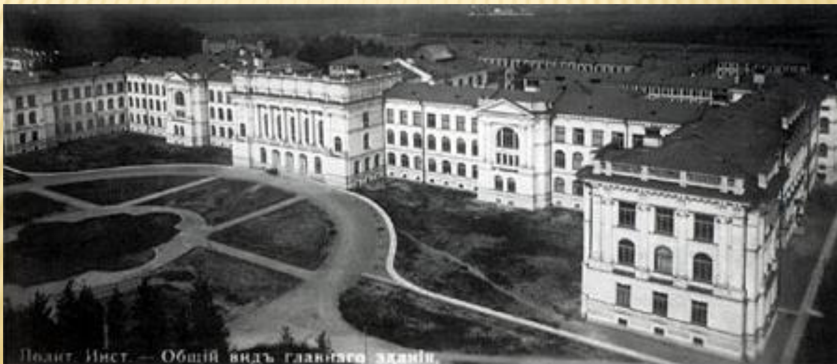
Подит. Инст. – Общій видъ главнаго зданія.