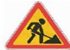
1.25 Дорожные работы