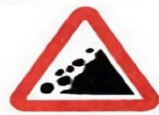
1.28 Падение камней