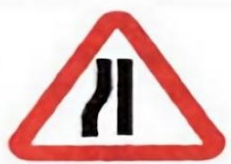
1.20.3 Сужение дороги