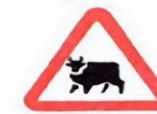
1.26 Перегон скота