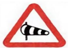
1.29 Боковой ветер