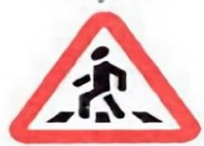
1.22 Пешеходный переход