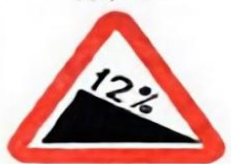
1.13 Крутой спуск