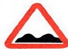
1.16 Неровная дорога