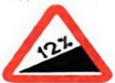
1.14 Крутой подъем