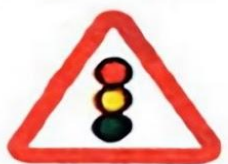
1.8 Светофорное регулирование