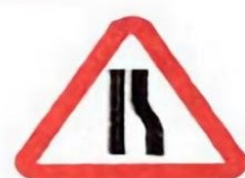
1.20.2 Сужение дороги