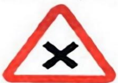
1.6 Пересечение равнозначных дорог