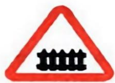
1.1 Железнодорожный переезд со шлагбаумом