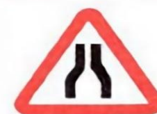
1.20.1 Сужение дороги