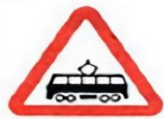
1.5 Пересечение с трамвайной линией