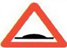
1.17 Искусственная неровность