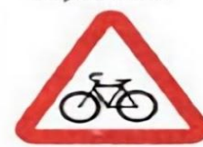
1.24 Пересечение с велосипедной дорожкой или велопешеходной дорожкой