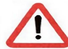
1.33 Прочие опасности