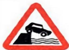
1.10 Выезд на набережную