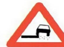
1.19 Опасная обочина