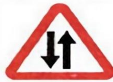
1.21 Двустороннее движение