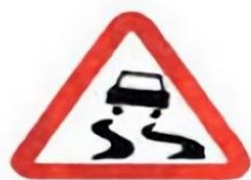
1.15 Скользкая дорога