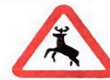
1.27 Дикие животные