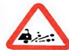
1.18 Выброс гравия