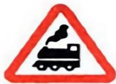
1.2 Железнодорожный переезд без шлагбаума