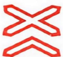
1.3.2 Многопутная железная дорога