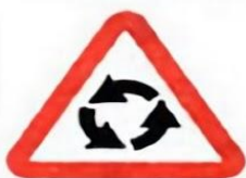
1.7 Пересечение с круговым движением