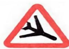
1.30 Низколетящие самолеты