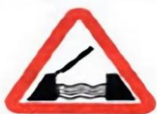
1.9 Разводной мост