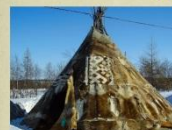
Чумы – жилища народов Крайнего Севера.