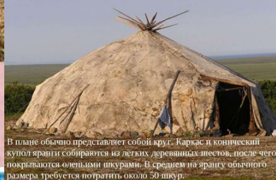
В плане обычно представляет собой круг. Каркас и конический купол яранги собираются из лёгких деревянных шестов, после чего покрываются оленьими шкурами. В среднем на ярангу обычного размера требуется потратить около 50 шкур.