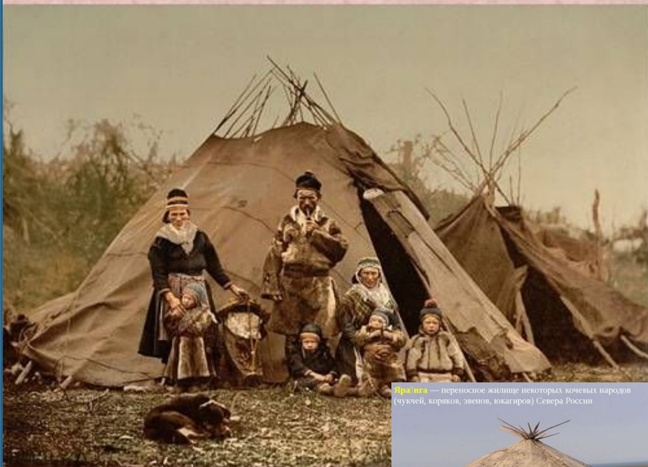
Яранга — переносное жилище некоторых кочевых народов (чукчей, коряков, эвенков, токагиров) Севера России

У кочевых народов Крайнего Севера (чукчей, эвенков, коряков и др.) существует своеобразное переносное жилище – яранга , имеющее цилиндрическую форму и коническую крышу. В плане обычно представляет собой круг. Каркас и конический купол яранги собираются из лёгких деревянных шестов, после чего покрываются оленьими шкурами. В среднем на ярангу обычного размера требуется потратить около 50 шкур.