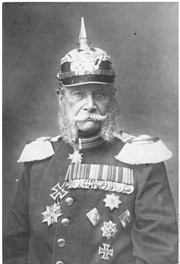
Вильгельм I – германский император 1871-1888 гг.