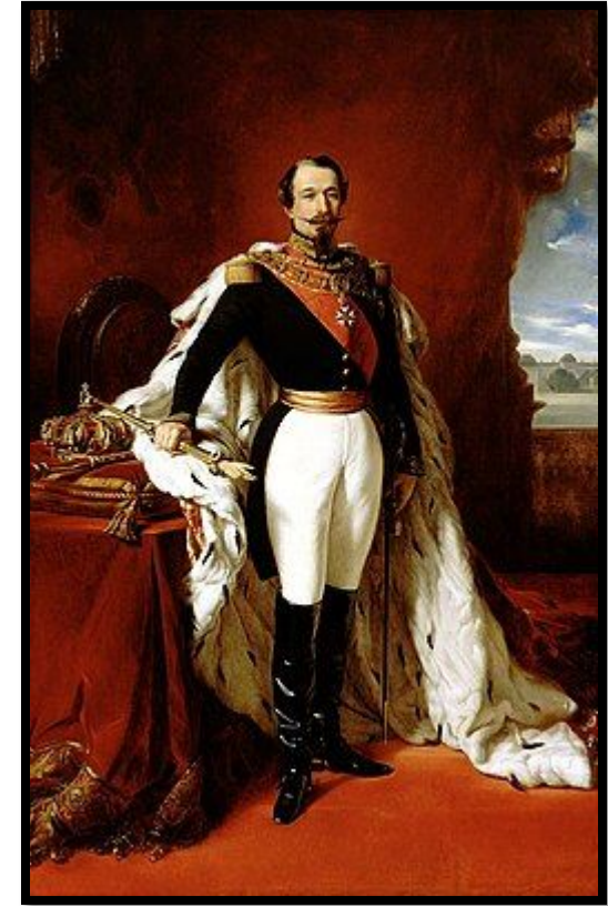
Вторая империя 1852-1870 гг. - период диктатуры Луи Наполеона Бонапарта (Наполеона III) во Франции.