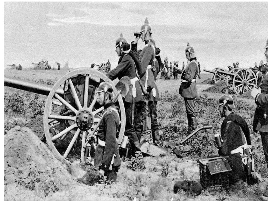
Дальнобойная пушка Круппа