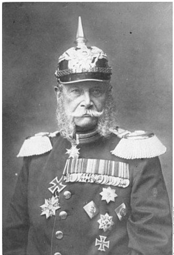
Вильгельм I – германский император 1871-1888 гг.