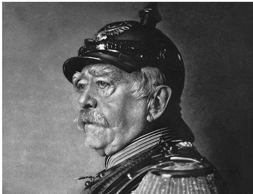
Отто фон Бисмарк – канцлер Германии