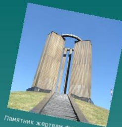
Памятник жертвам фашизма