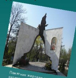
Памятник жертвам чернобыльской катастрофы