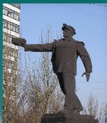
Памятник шахтерскому труду