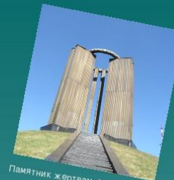
Памятник жертвам фашизма