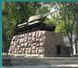
Памятник гвардии полковнику Гринкевичу