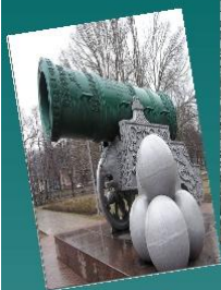
Царь - пушка