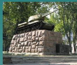
Памятник гвардии полковнику Гринкевичу