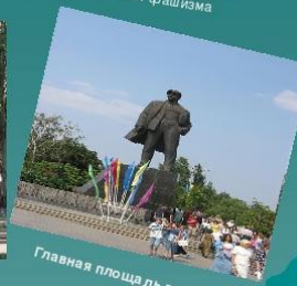
Главная площадь г. Донецка