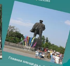
Главная площадь г. Донецка