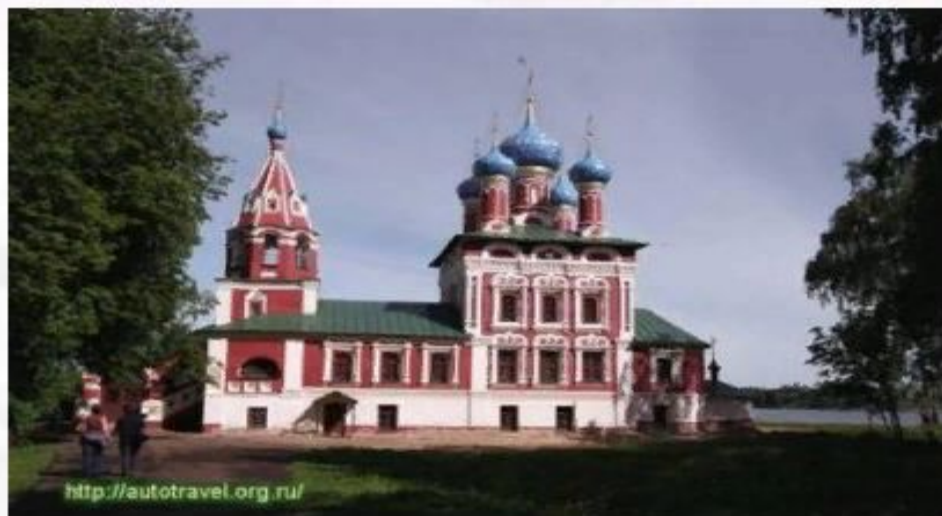
Церковь царевича Дмитрия