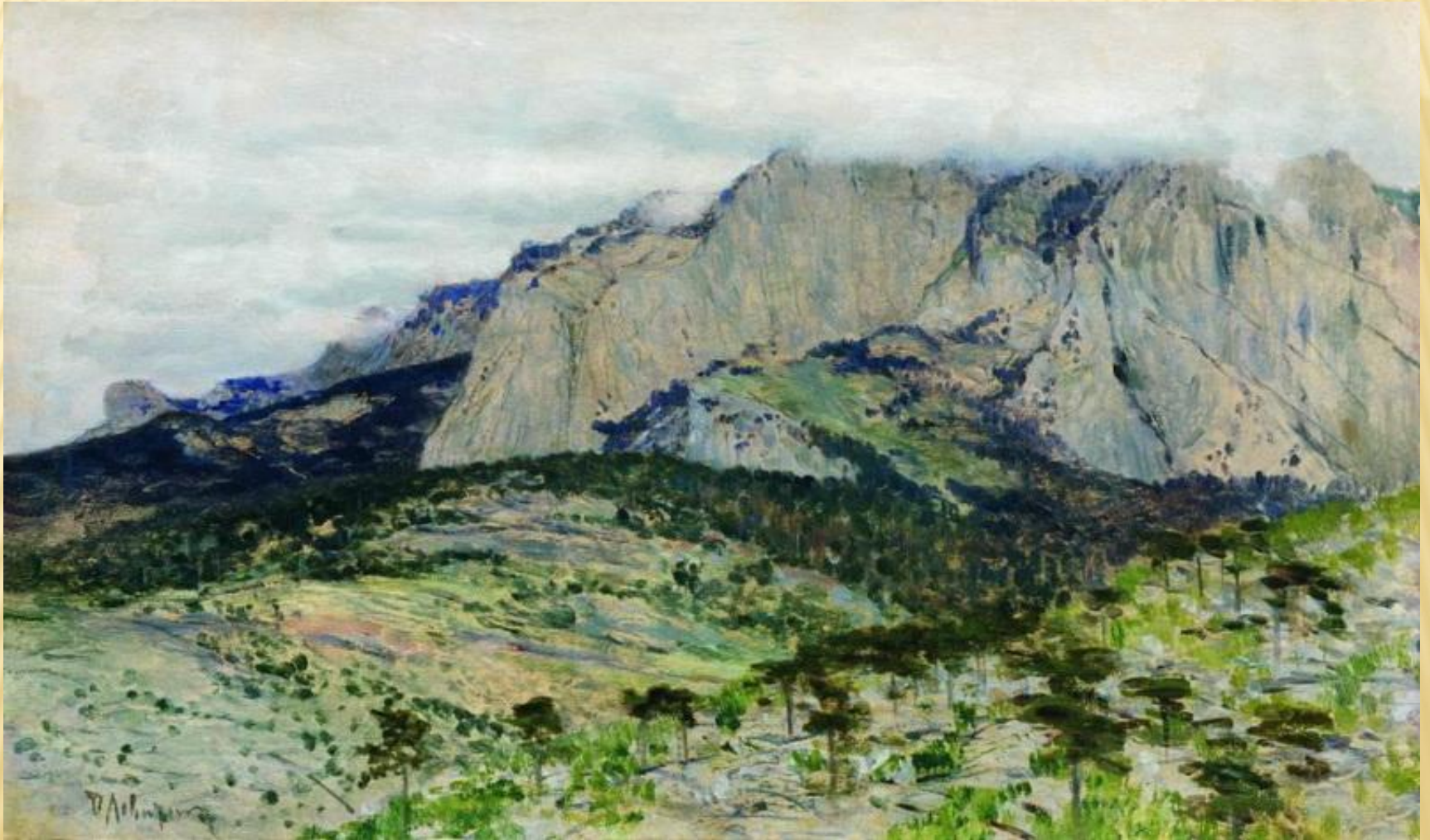
И. Левитан 1869 год