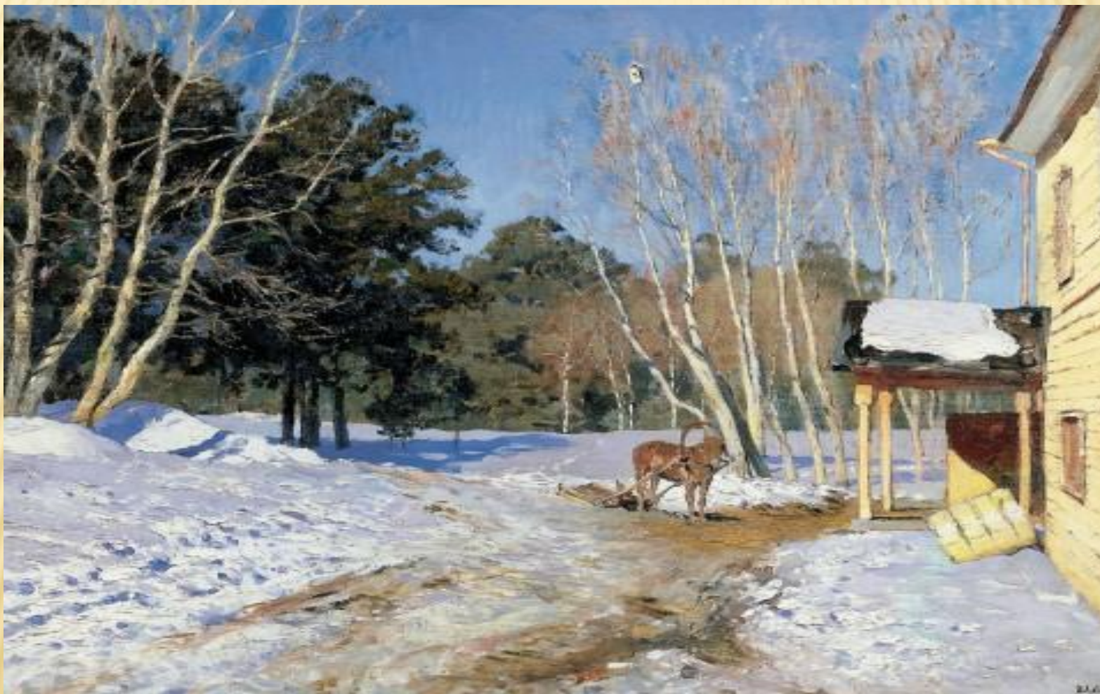
И. Левитан 1895 г.