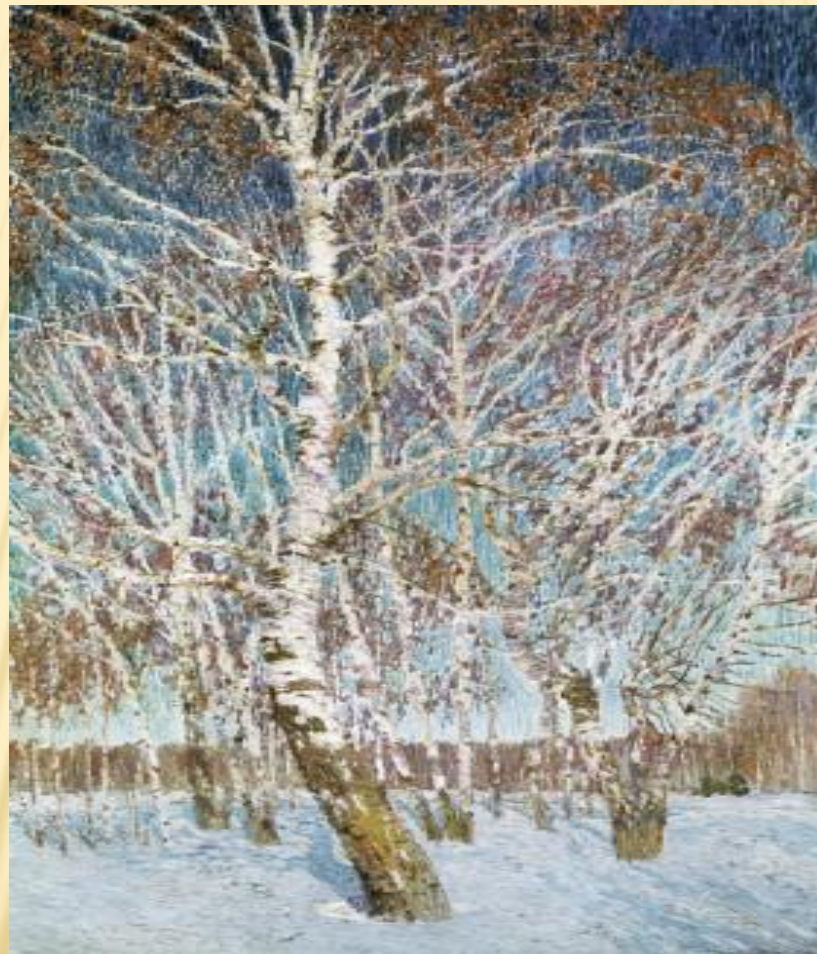
И. Грабарь 1904г.