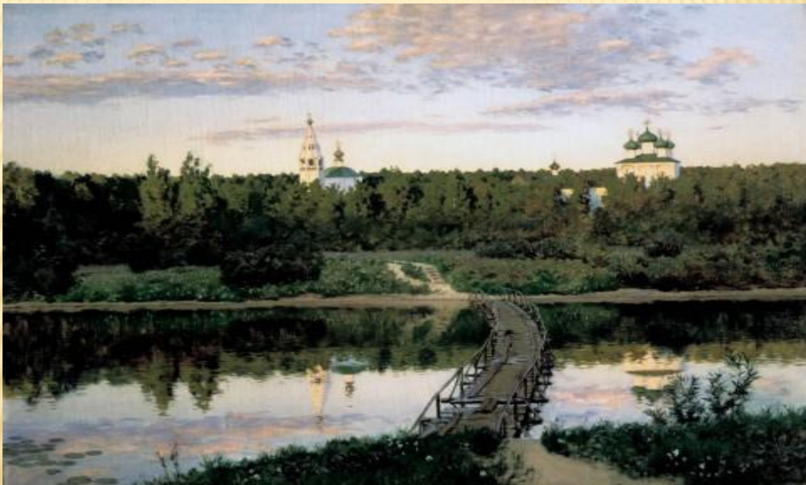
И. Левитан 1892г