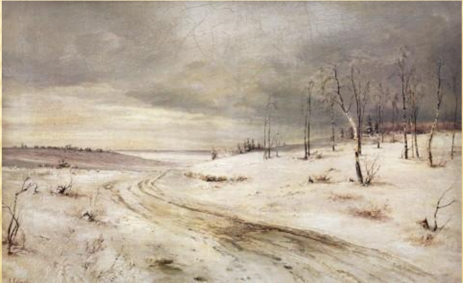
А. Саврасов 1870 г.