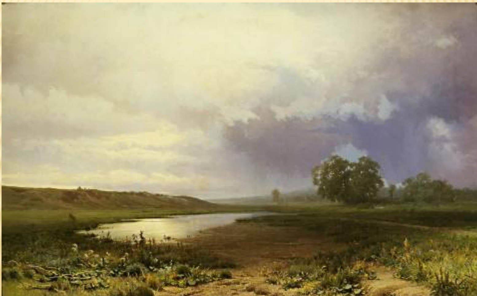
МОКРЫЙ ЛУГ 1872 г.