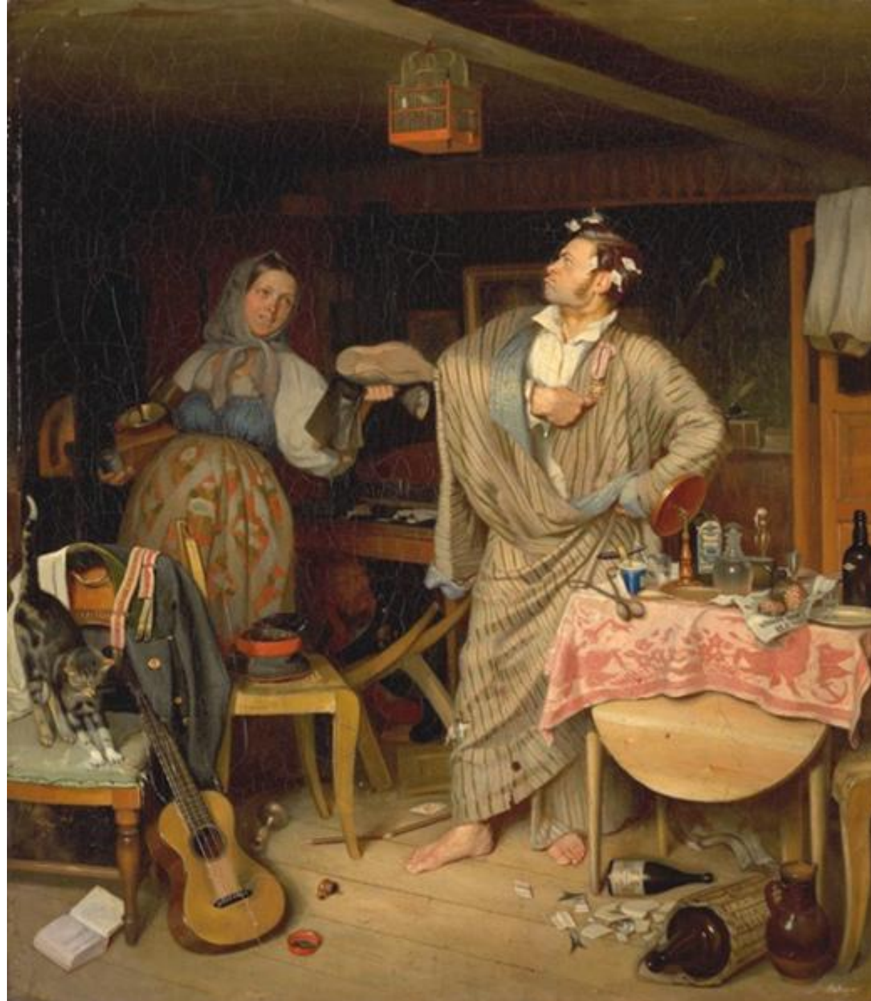
Павел Андреевич Федотов «Свежий кавалер»