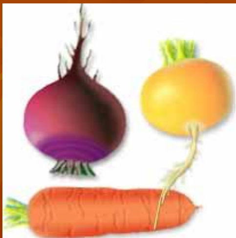
Свекла, морковь, репа