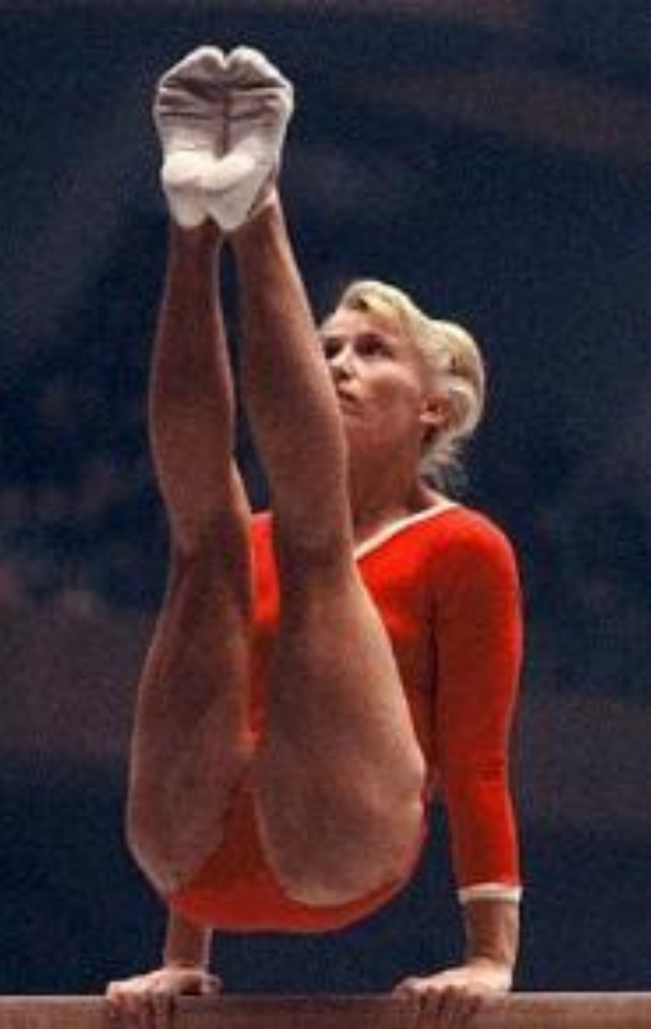
Астахова Полина Григорьевна

Занималась гимнастикой с 13 лет, когда из-за опоздания к началу учебного года (в связи с переездом родителей в другой город) решила уйти из школы и поступить в Донецкий техникум физической культуры и спорта. В 1954 году впервые участвовала в чемпионате СССР. Выступала на мировом уровне с 1956 года, когда была самой юной участницей советской гимнастической сборной на Олимпиаде в Мельбурне.