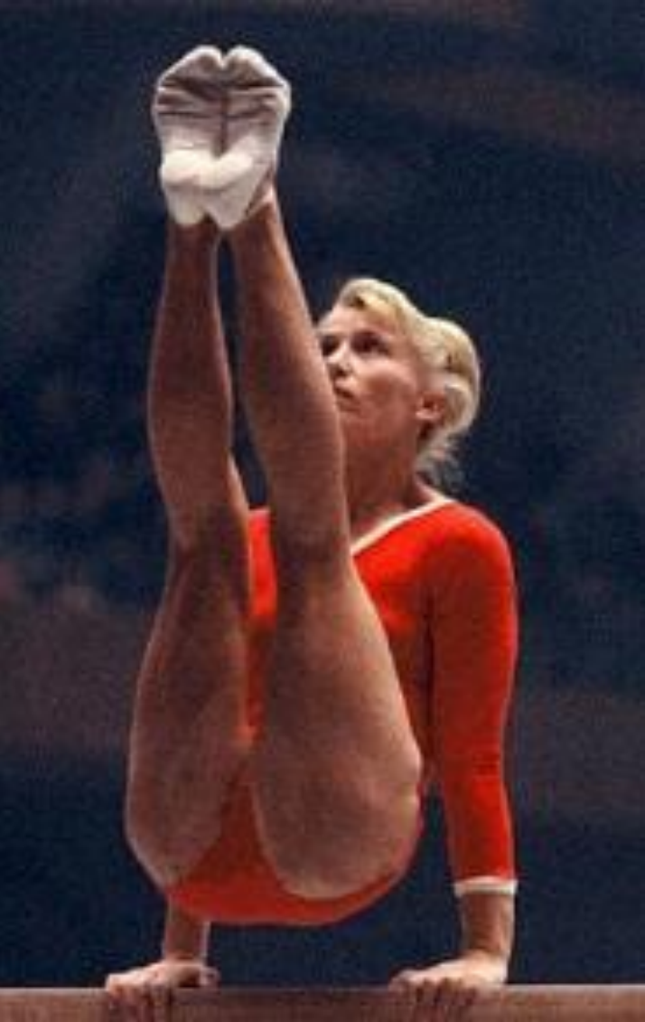
Астахова Полина Григорьевна

Занималась гимнастикой с 13 лет, когда из-за опоздания к началу учебного года (в связи с переездом родителей в другой город) решила уйти из школы и поступить в Донецкий техникум физической культуры и спорта. В 1954 году впервые участвовала в чемпионате СССР. Выступала на мировом уровне с 1956 года, когда была самой юной участницей советской гимнастической сборной на Олимпиаде в Мельбурне.