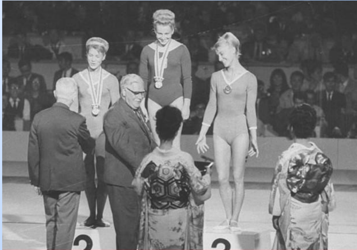
Бронзовая медаль в абсолютном первенстве в Токио 1964 год

Все-таки, стабильность – признак мастерства! Абсолютное повторение результатов прошлой Олимпиады. Вот, так все просто и буднично. Повторила результаты... Однако, ТРЕТЬИ олимпийские игры. Это сколько труда, сил, здоровья положено, чтобы вот так «просто» повторить результаты четырех летней давности.