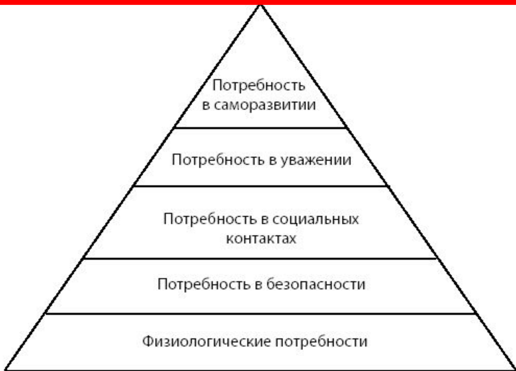
Схема 2.2. Классификация потребностей по А. Маслоу