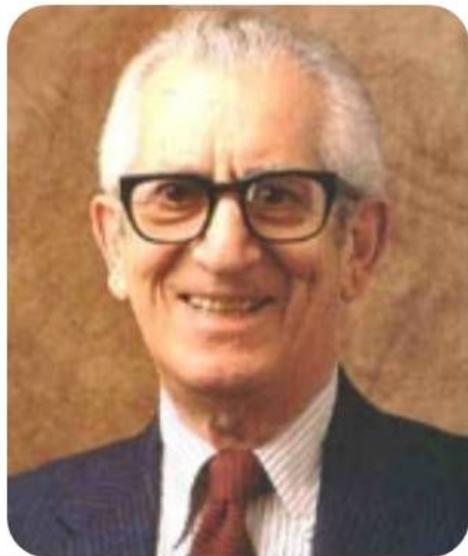
Бенджамин Блум (1913-1999)

Бенджамин Блум – америкалық оқыту әдістемесінің психологі, Блум таксономиясының авторы. Пенсильванияда Ленсфорд қаласында туылған, 1935 жылы Пенсильван университетін бакалавр және магистр деңгейлерін бітірген, 1942 жылы Чикаго университетінде докторлық деңгейін қорғады. «Блум таксономиясы» атты кітабында өз теориясын дамытқан: адами мінездеменің өзгеруі мен бірқалыптылығы және білім беру мақсаттарын жүйелеу.