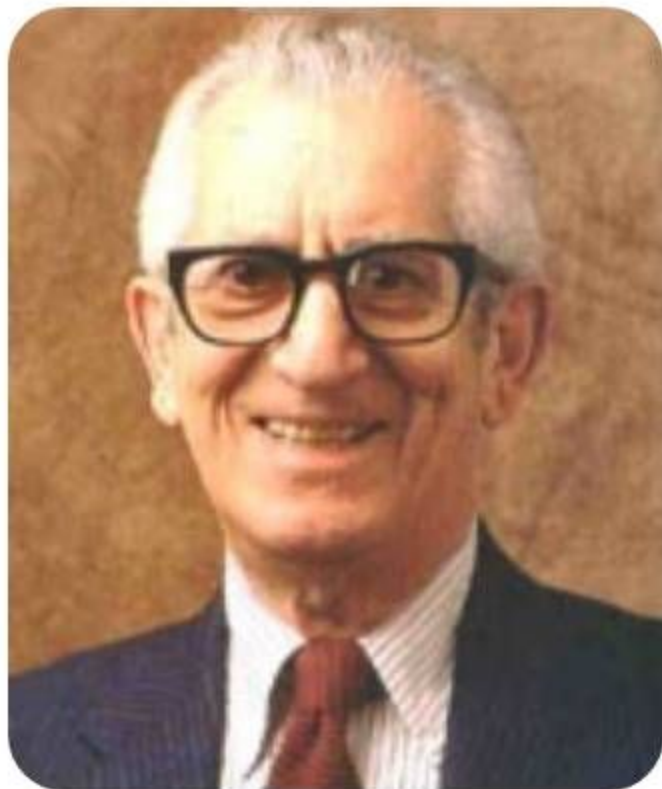
Бенджамин Блум (1913-1999)

Бенджамин Блум – америкалық оқыту әдістемесінің психологі, Блум таксономиясының авторы. Пенсильванияда Ленсфорд қаласында туылған, 1935 жылы Пенсильван университетін бакалавр және магистр деңгейлерін бітірген, 1942 жылы Чикаго университетінде докторлық деңгейін қорғады. «Блум таксономиясы» атты кітабында өз теориясын дамытқан: адами мінездеменің өзгеруі мен бірқалыптылығы және білім беру мақсаттарын жүйелеу.