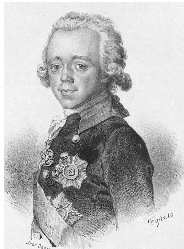
Павел I (1754 - 1801), император Всероссийский с 1796 по 1801 гг.

У кого и почему внутренняя политика Павла I вызывала чувство «скорби и отвращения» и вызывала ненависть ?