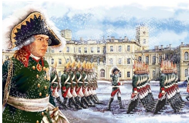
Парад при Павле I в Гатчине

Армия Павла отработывала способы ведения современной войны: приемы залпового огня и штыкового боя, взаимодействия различных родов войск при форсировании водных преград, передвижения войск в ночное время. Конная артиллерия Павла стала первой постоянной конноартиллерийской частью в русской армии