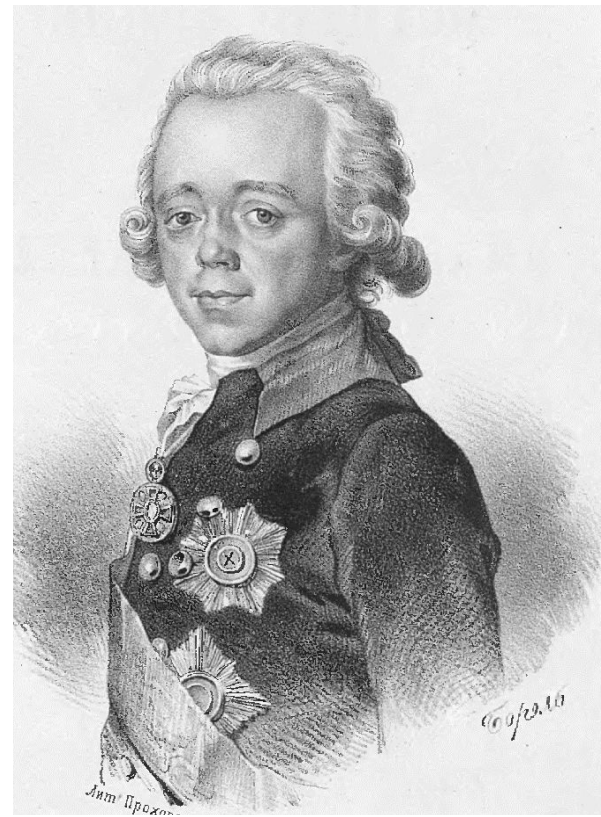
Павел I (1754 - 1801), император Всероссийский с 1796 по 1801 гг.

У кого и почему внутренняя политика Павла I вызывала чувство «скорби и отвращения» и вызывала ненависть ?