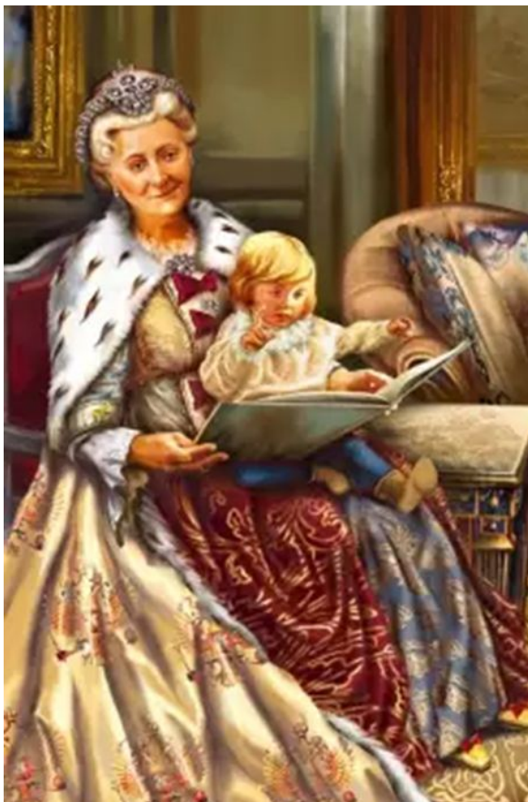
Екатерина II с внуком Александром