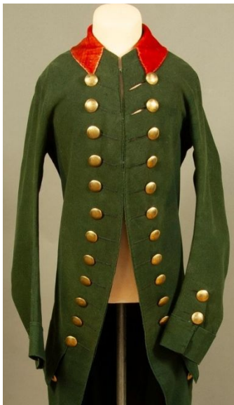
Офицерский мундир Павла I