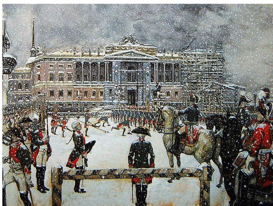
«Вахтпарад при императоре Павле I». А. Н. Бенуа, русский художник

«Подобное обращение держало офицеров в постоянном страхе и беспокойстве»