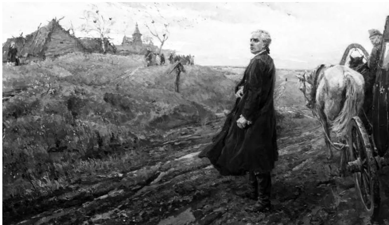
Иллюстрация из книги А.Н. Радищева «Путешествие из Петербурга в Москву»

Павел I любил повторять: «В России велик лишь тот, с кем я говорю, и до тех пор, пока я с ним говорю»