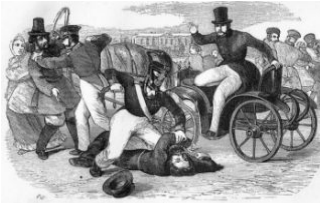
«Архаровцы» наводят порядок в столице