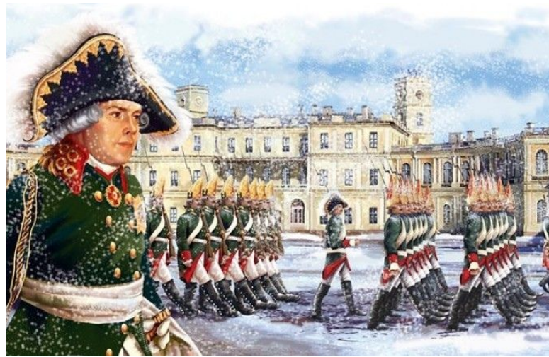
Парад при Павле I в Гатчине

Армия Павла отработывала способы ведения современной войны: приемы залпового огня и штыкового боя, взаимодействия различных родов войск при форсировании водных преград, передвижения войск в ночное время. Конная артиллерия Павла стала первой постоянной конноартиллерийской частью в русской армии