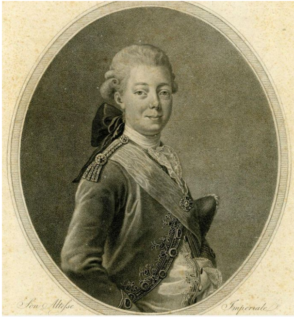
Портрет великого князя Павла Петровича. Скородумов Гавриил Иванович (1755—1797), русский художник

Детство Павла прошло при дворе императрицы Елизаветы Петровны, разлучившей ребенка с матерью. По некоторым данным, она собиралась объявить Павла наследником престола вместо его отца — своего племянника Петра Фёдоровича, которого она недолюбливала