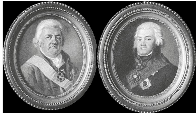
Николай Петрович Архаров, столичный генерал-губернатор (1796—1797); Иван Петрович Архаров, московский генерал - губернатор (1796—1797)

Наделение полицейских властей большими полномочиями для наведения порядка обернулось злоупотреблениями с их стороны. Излишнее рвение служителей порядка способствовало беззаконию - произвольным арестами, конфискации имущества