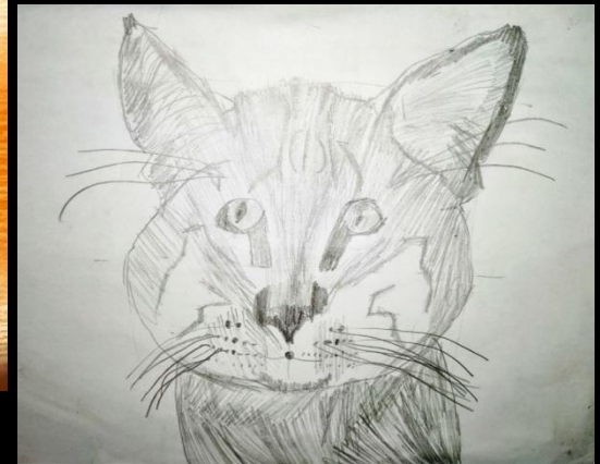
Бацула Таня (2В)