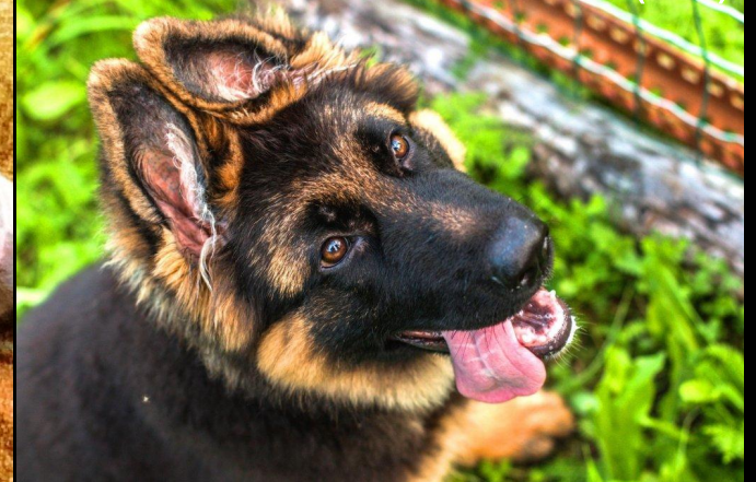
Плотникова Анжелика (4Б)