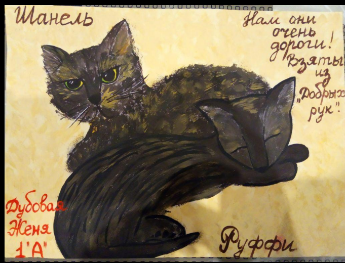
Дубовая Евгения (1А)