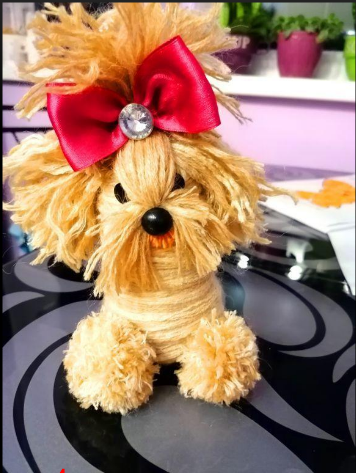
Огородов Денис (4А)