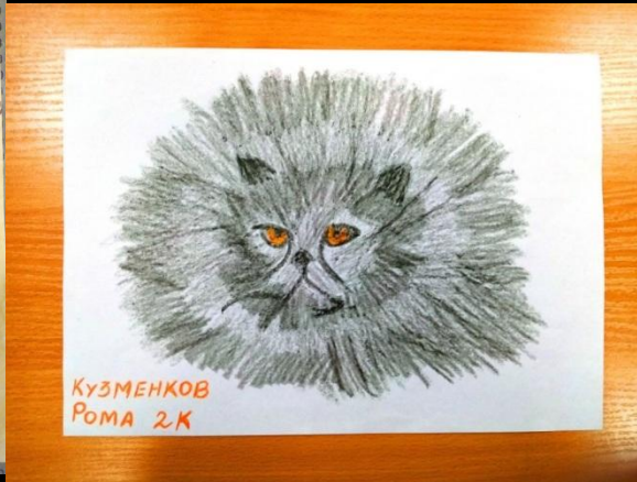
Кузменков Рома (2К)