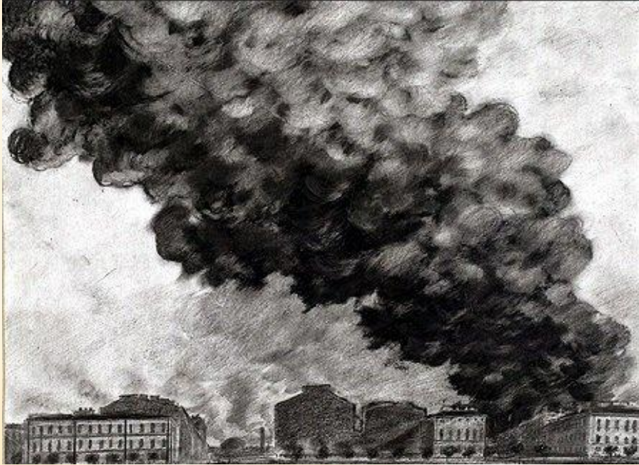
А.Никольский. Пожар Бадаевских складов. Рисунок сделан в 1941 г. Фонды Эрмитажа