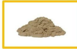
Песочница с песком и совком

Взрослый читает предложение, ребенок четко повторяет. (2-3 раза) . Сначала медленно, выделяя звук С во всех словах, затем обычный темп .