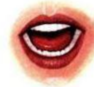
4. НАКАЗАТЬ НЕПОСЛУШНЫЙ ЯЗЫЧОК

Широко открыть рот, как можно дальше разведя уголки губ. Язык лежит во рту спокойно и неподвижно.