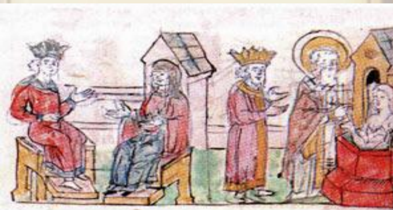
VI. Княгиня Ольга на приеме у императора и ее крещение.