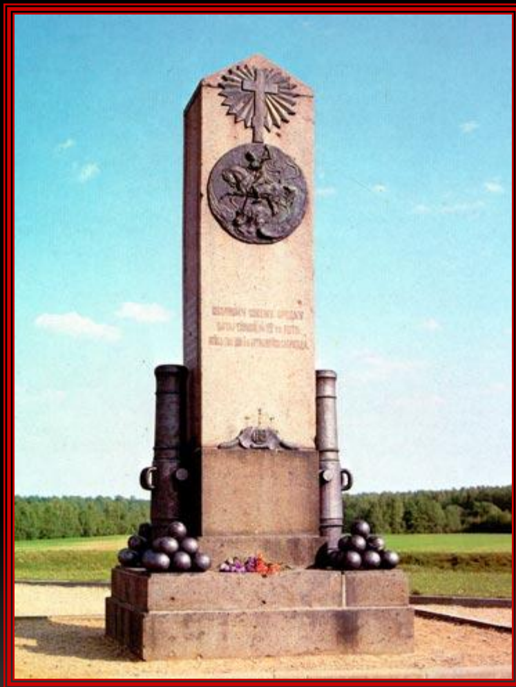
Памятник 12 роте на Шевардинском редуте