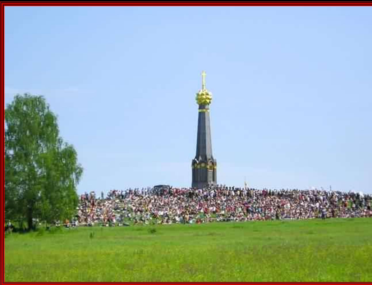
Главный монумент героям Бородинского сражения на батарее Раевского