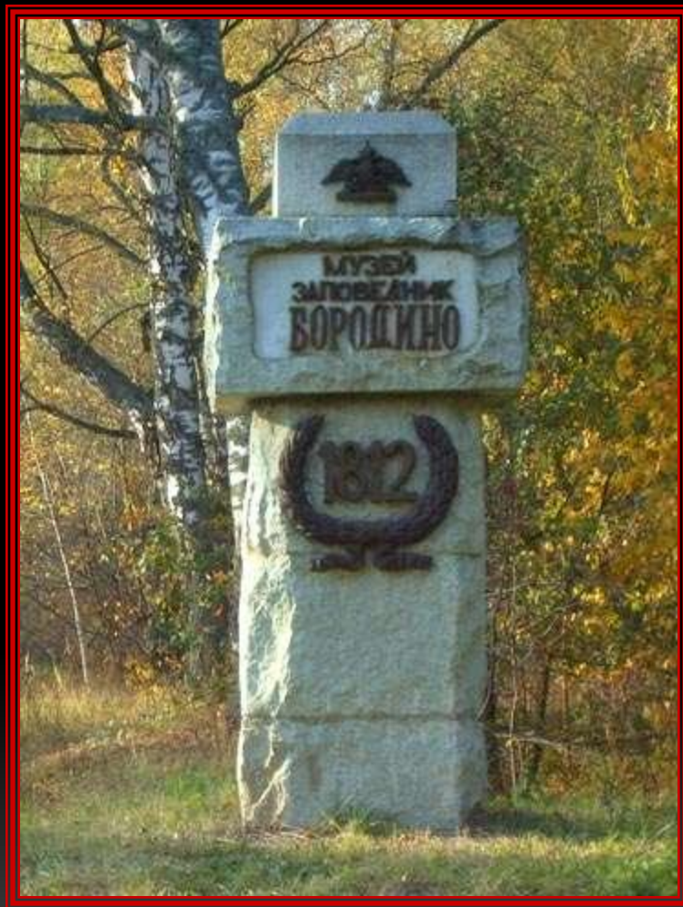
Памятный знак на границе Бородинского поля