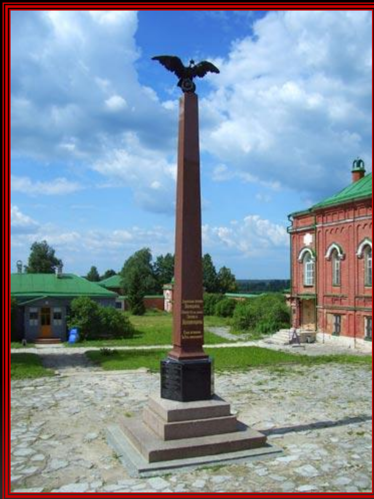
Памятник третьей Пехотной дивизии