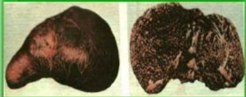
Печень здорового (слева) и страдающего алкоголизмом (справа) человека.