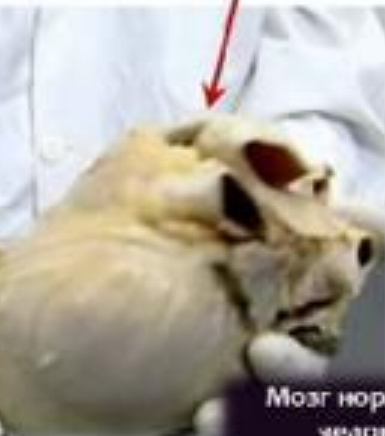
Сердце умеренно пившего пиво