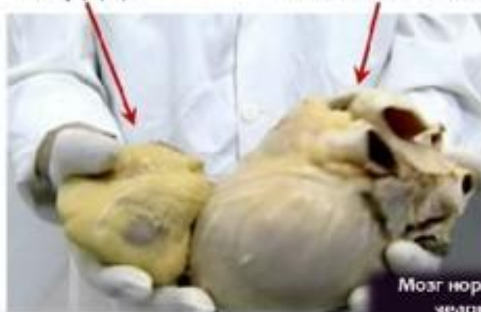
Сердце умеренно пившего пиво