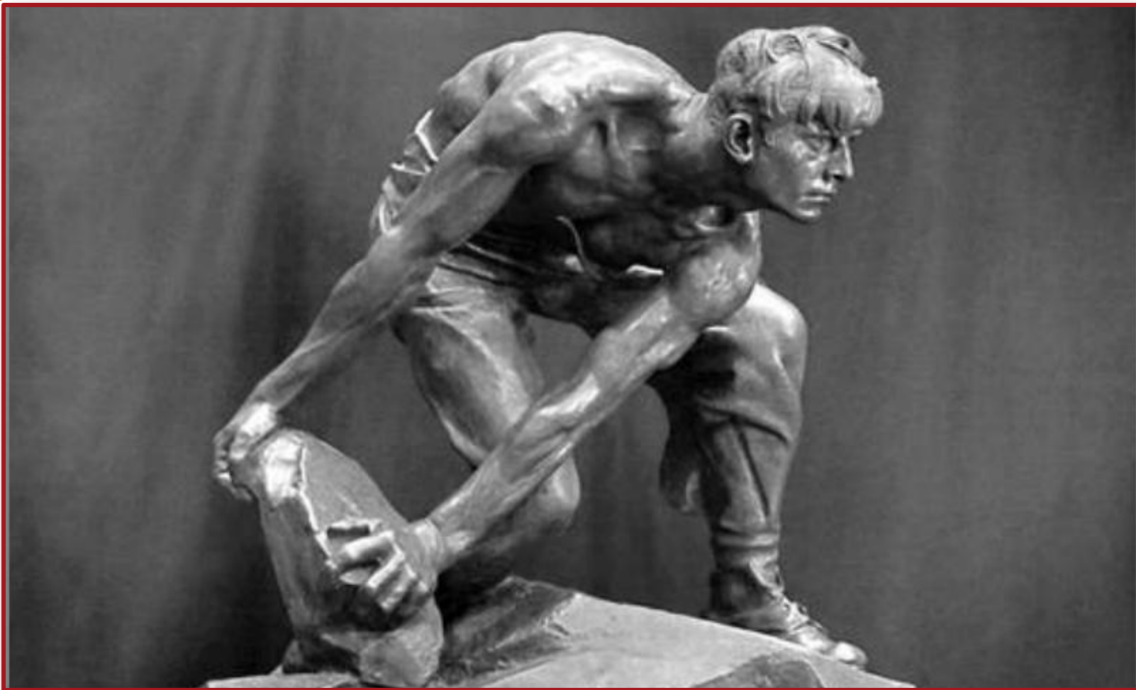
И.Д. Шадр. Булыжник – оружие пролетариата. 1927 г.