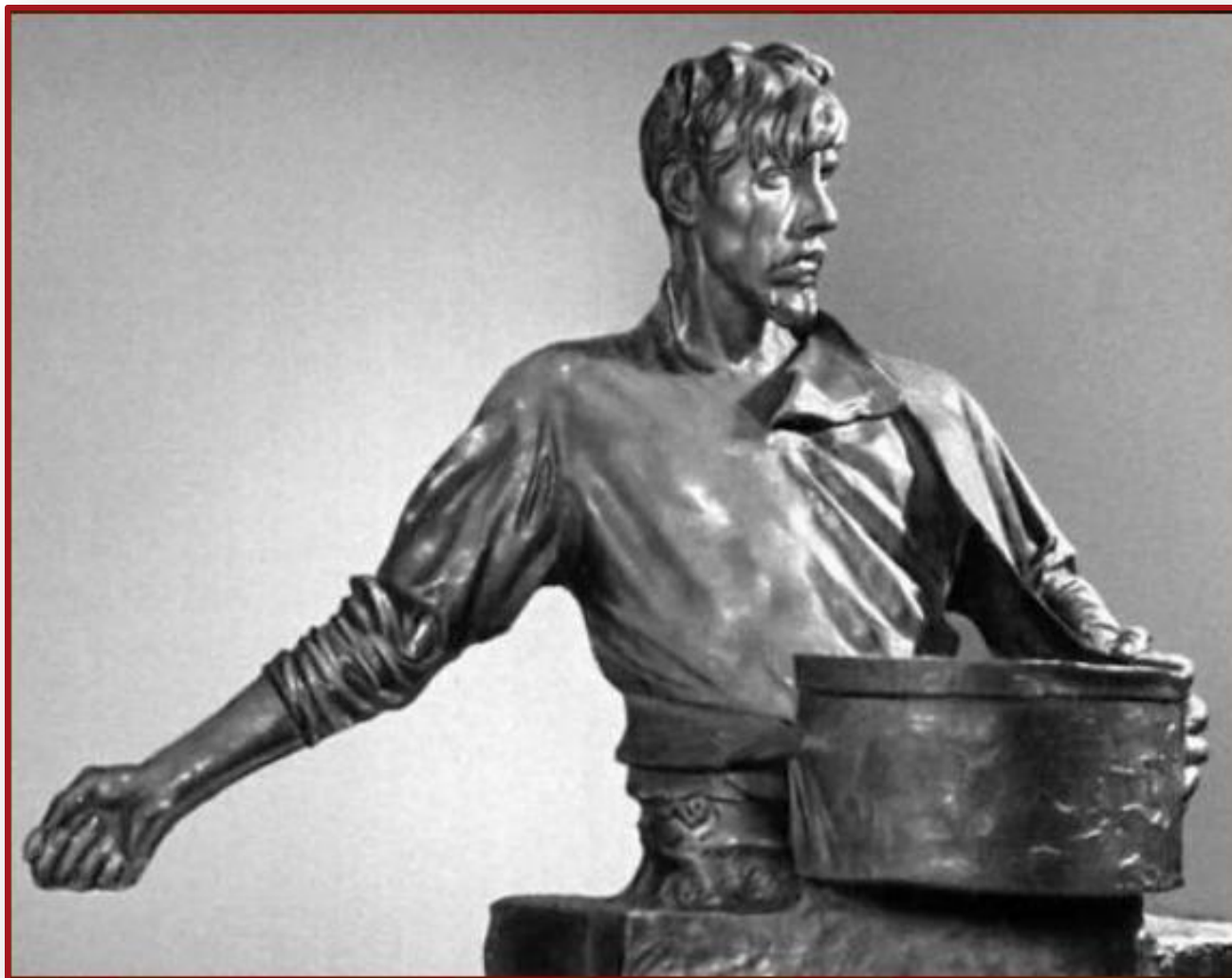
И.Д. Шадр. Сеятель. 1922 г.