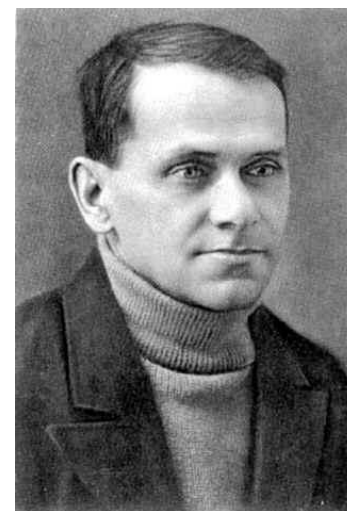
Блонский Павел Петрович (1884-1941)