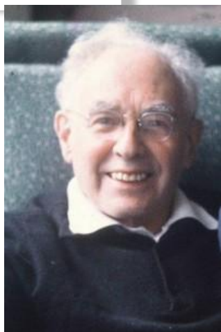
Лурия Александр Романович (1902-1977)