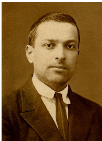
Рубинштейн Сергей Леонидович (1889-1960)