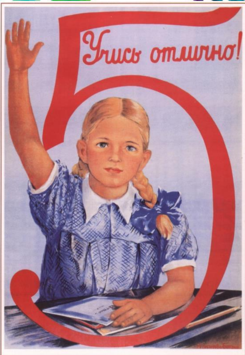
476. Нестерова–Берзина М. Учись отлично! 1948