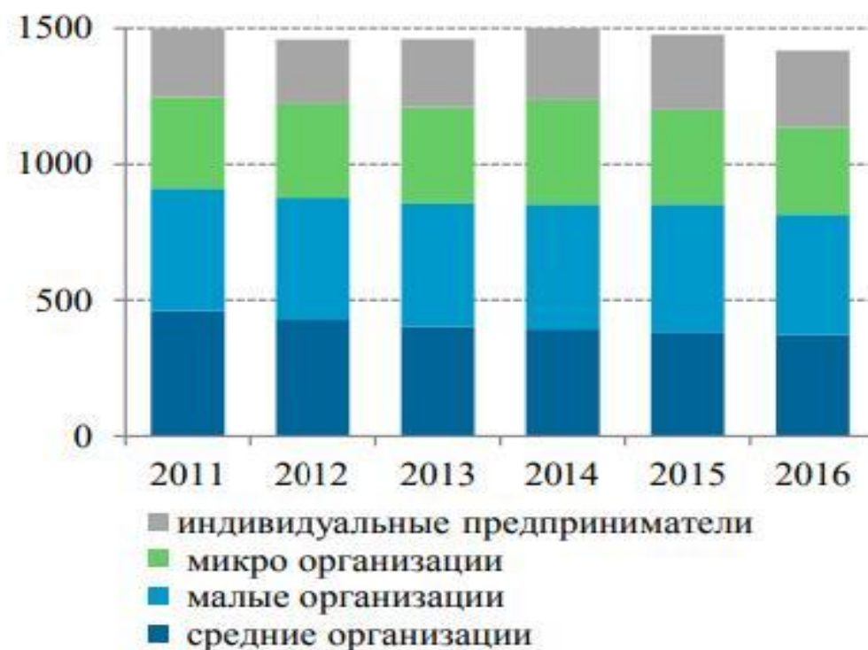
(б) численность работников, тыс. чел.