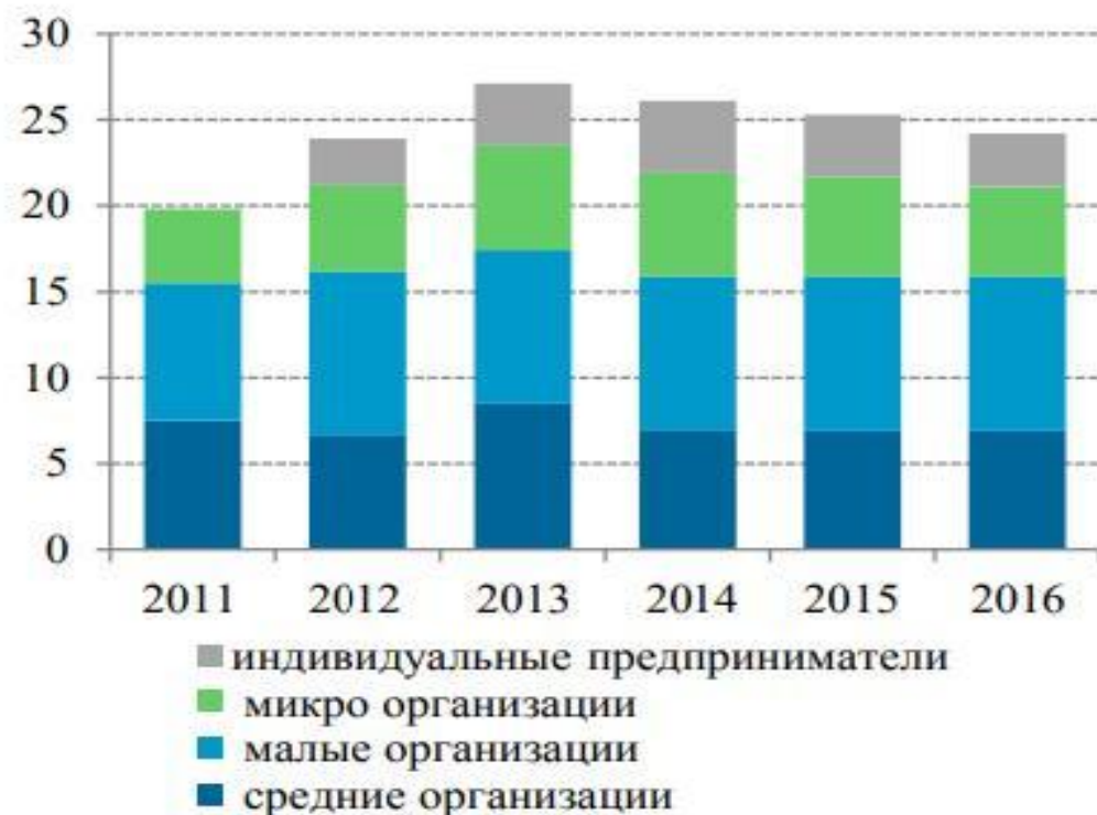
(а) доля в ВВП, %