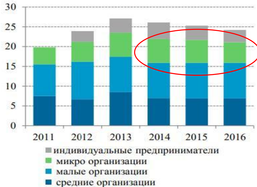
(а) доля в ВВП, %