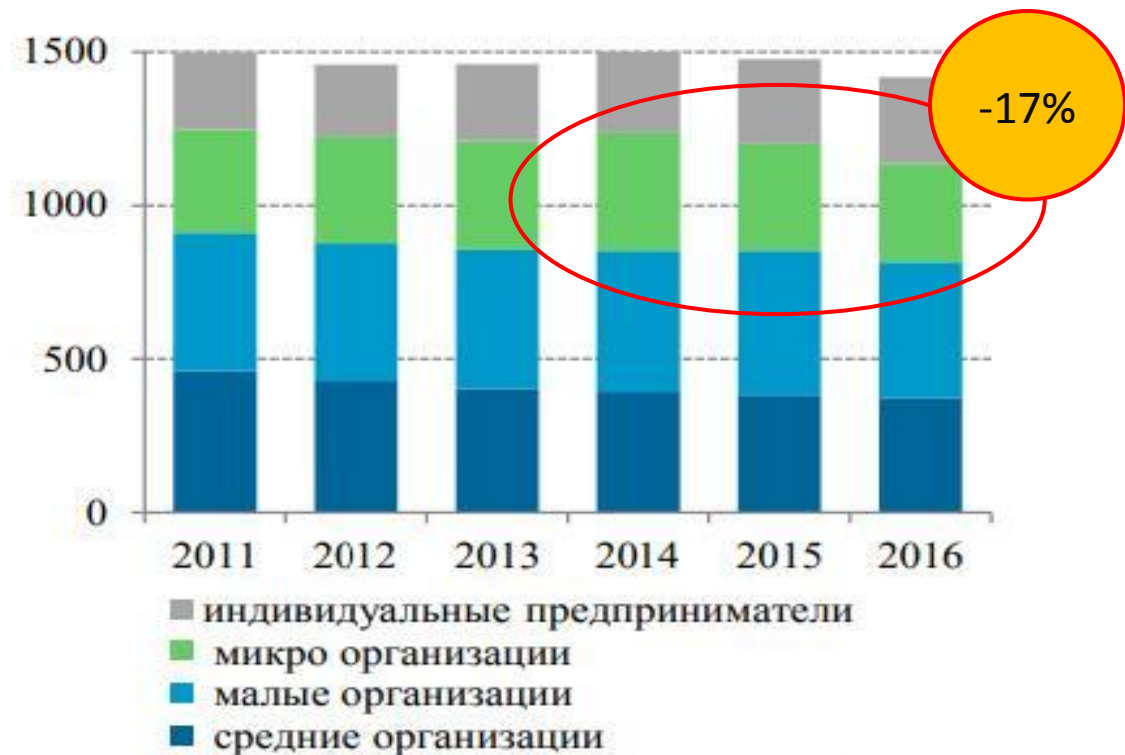
(б) численность работников, тыс. чел.