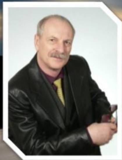
Лидер менеджер компании NSP