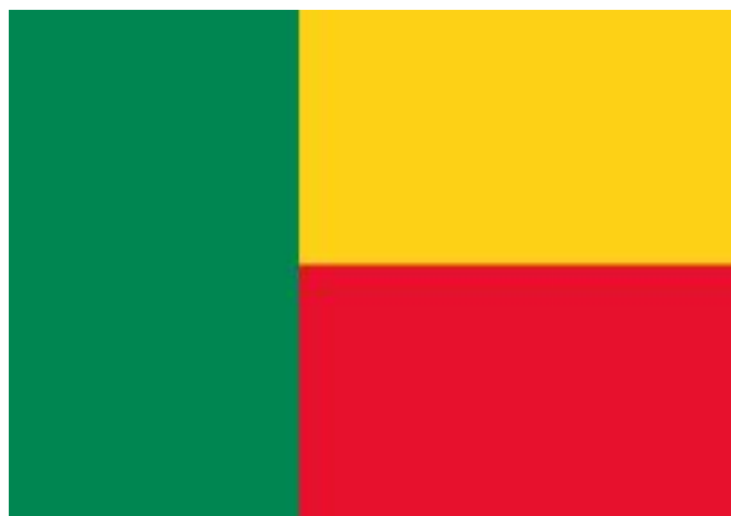
Бенин республикасының туы