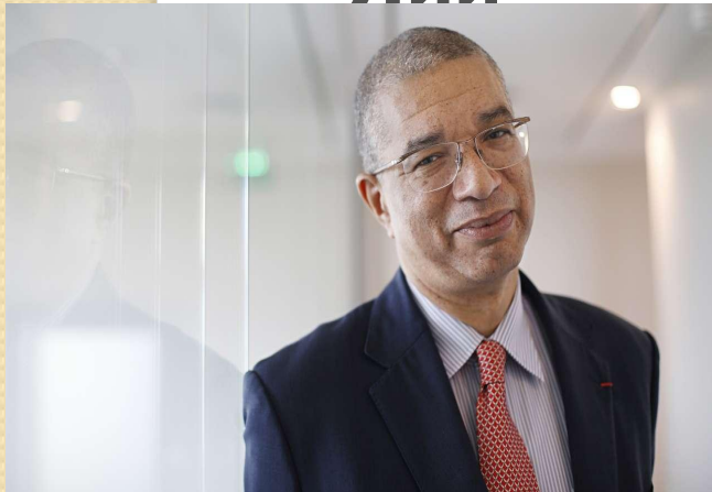
Премьер- министр, кәсіпкер-Лионель Зинсу