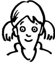
Iiris 8 vuotta