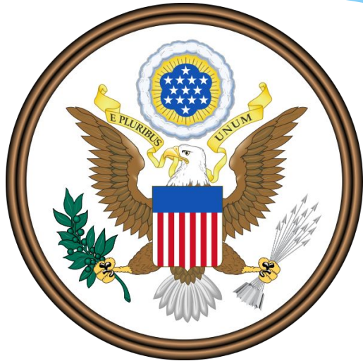
Большая печать Соединённых Штатов