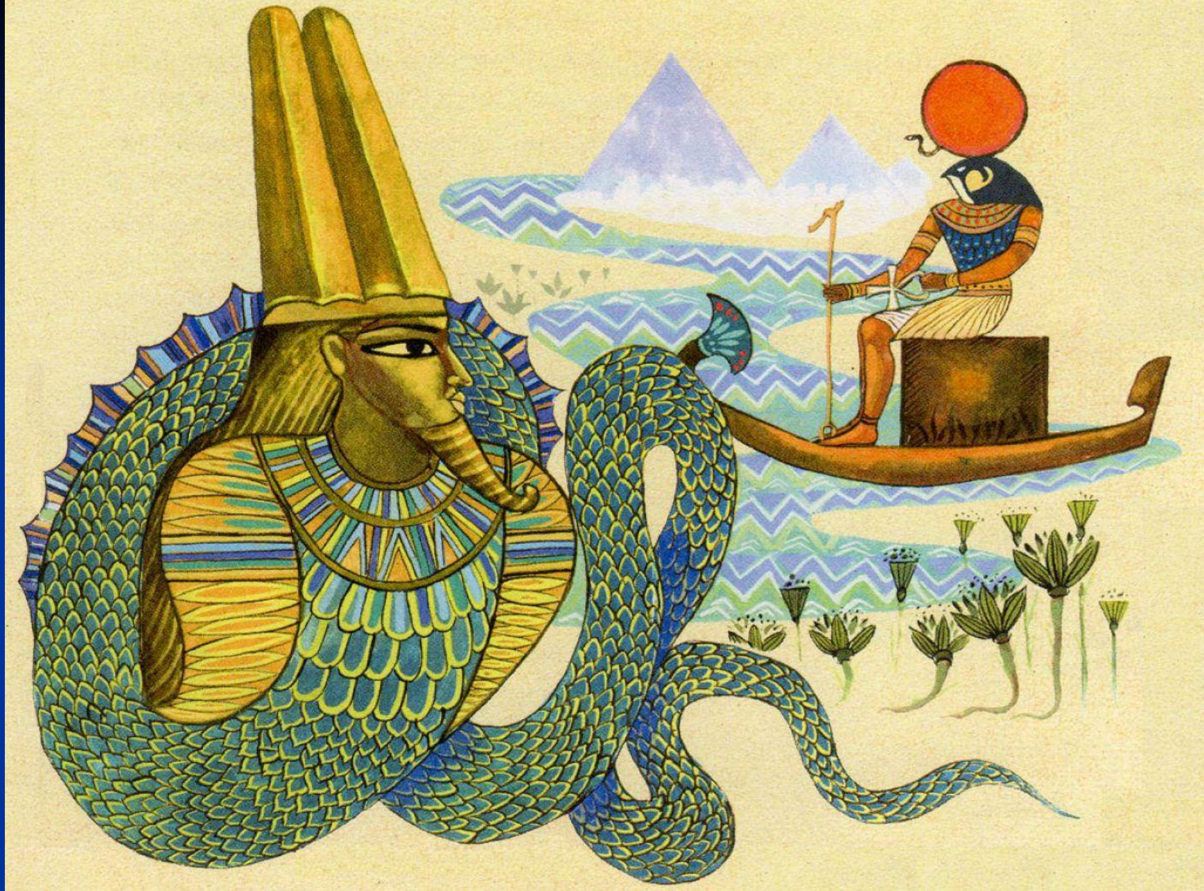
Поединок Ра с великим змеем Апопом . Рисунок