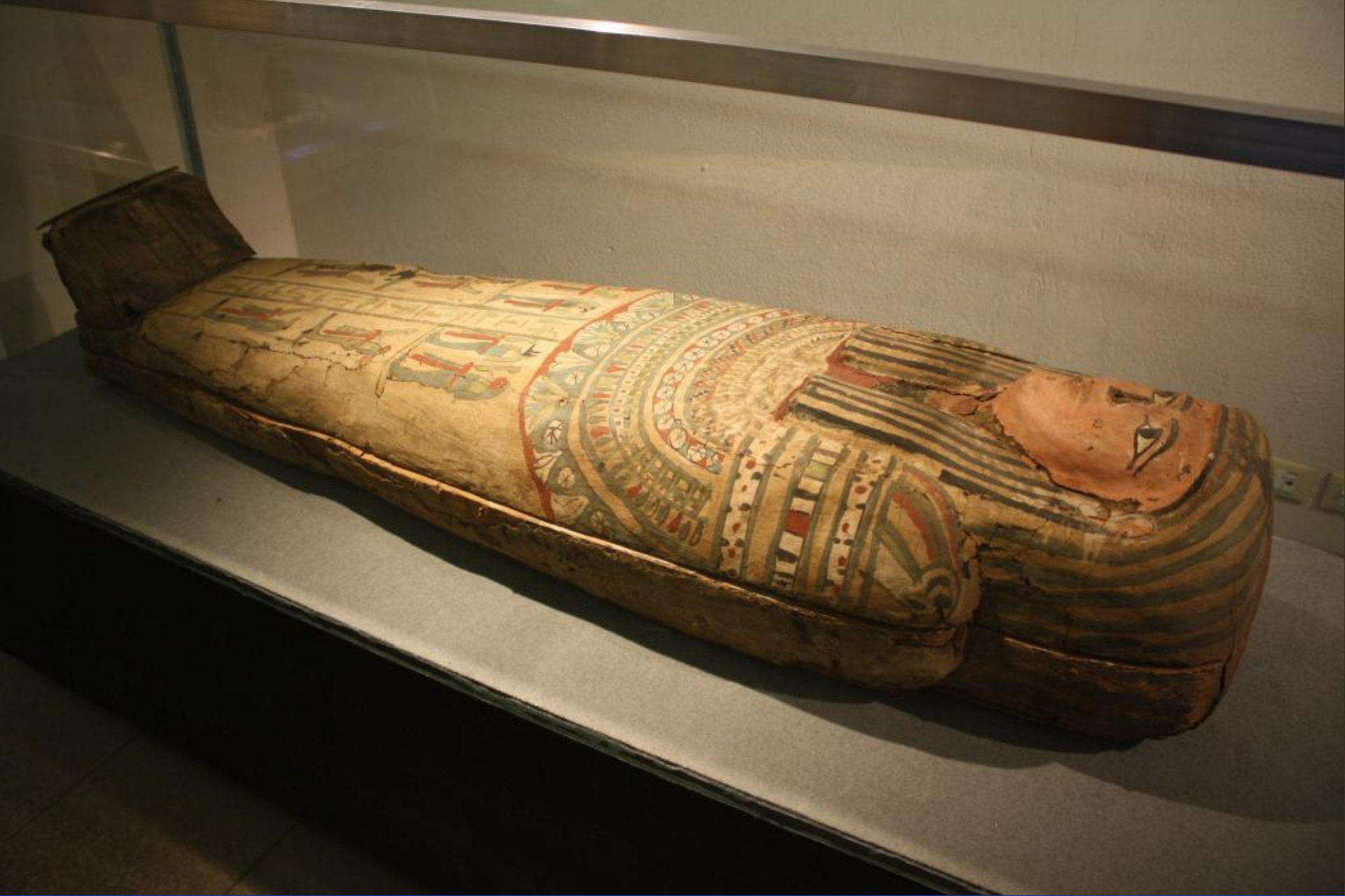
Египетский саркофаг. Фото