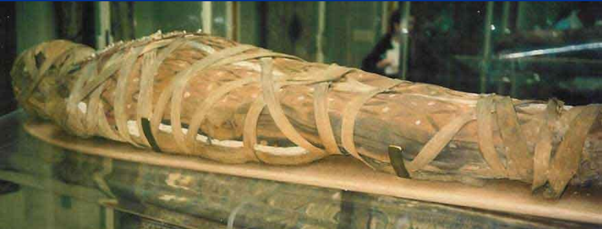
Египетская мумия. Фото

Для жизни в загробном мире нужно тело: появление мумий и саркофагов