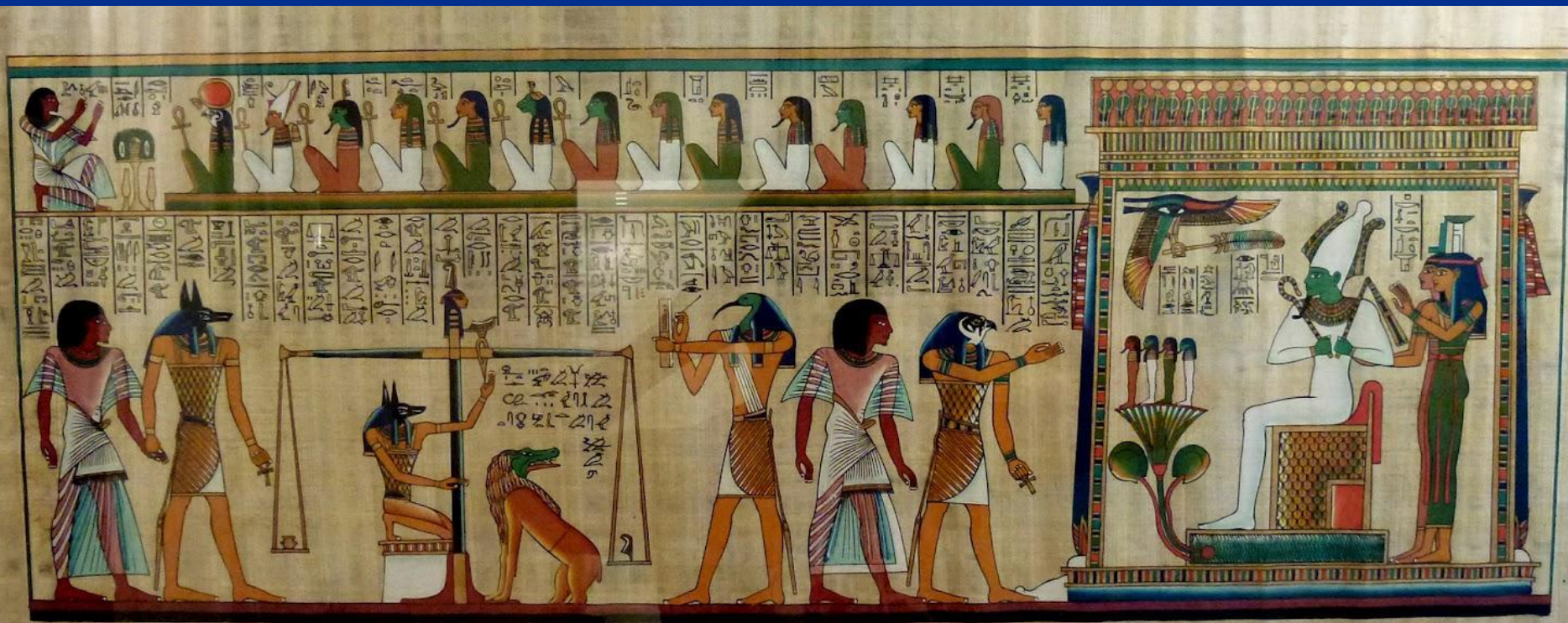
Суд Осириса. Египетский рисунок

После смерти душа попадает в загробный мир, на суд Осириса