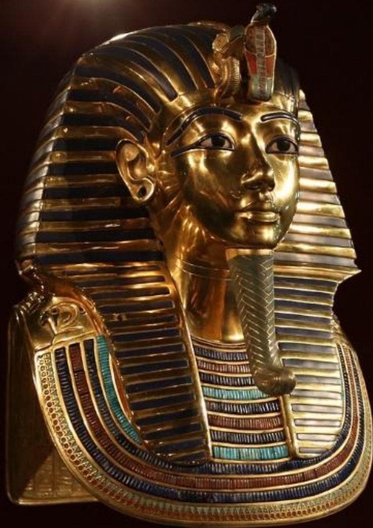
Посмертная маска фараона Тутанхамона. Фото