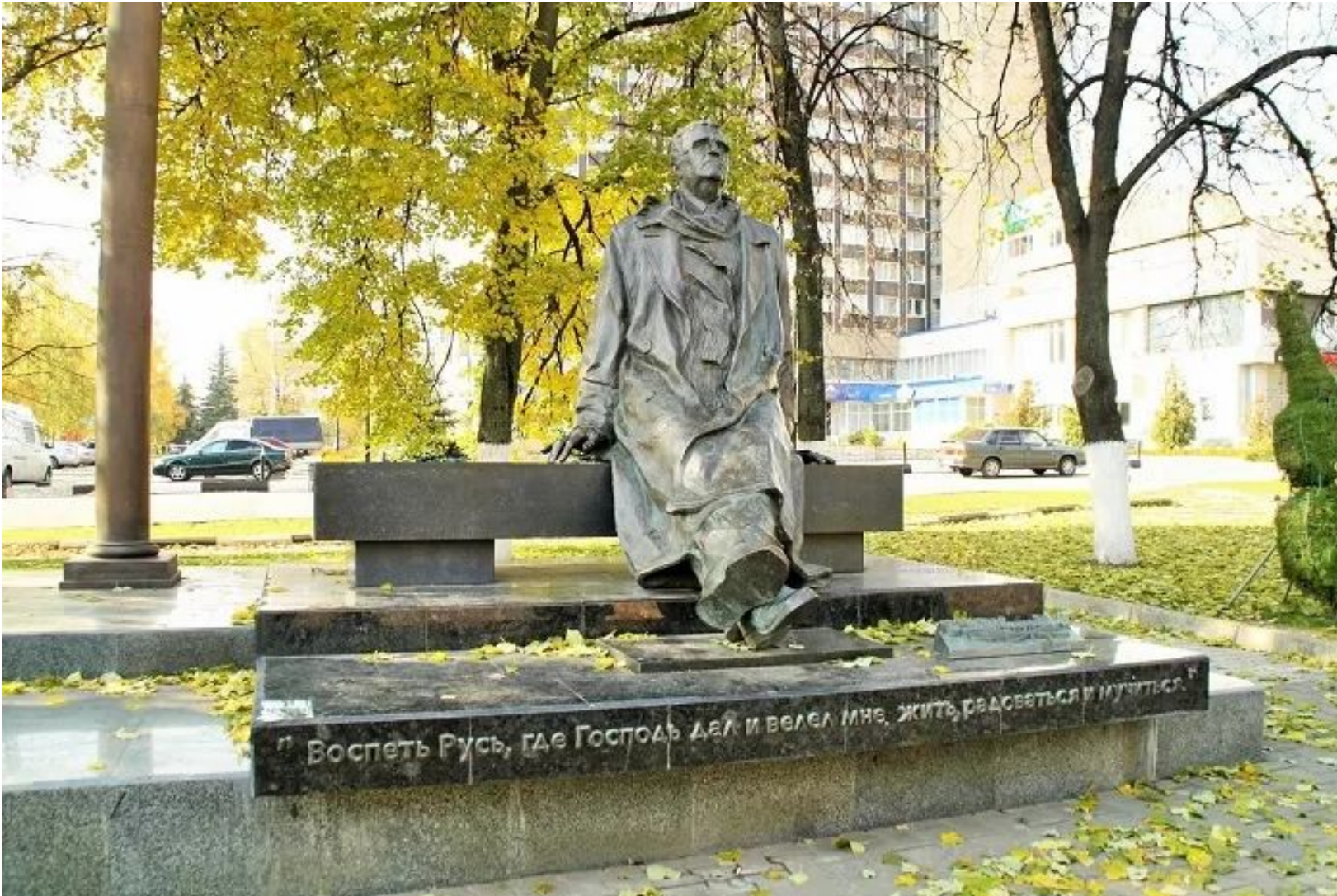
Памятник Г.Свиридову в городе Курске

Своей основной формой творчества Георгий Свиридов выбрал песню. Он черпал вдохновение в том, чем живет народ, считая, что искусство должно быть простым и понятным. Будучи человеком религиозным, он помнил, что вначале было слово. Именно слово композитор ставил превыше всего. Поэтому и посвятил свою жизнь соединению слова и музыки.