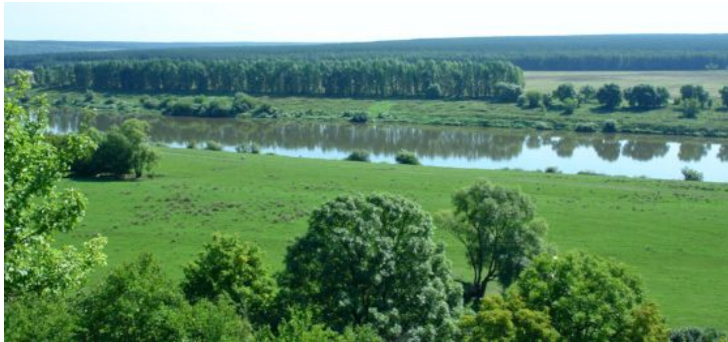
Вид родины Г. Свиридова

Семья переехала в Курск, где маленький Юра, как в детские годы называли будущего музыканта, начал играть на балалайке, а затем способного ребенка приняли в оркестр народных инструментов.