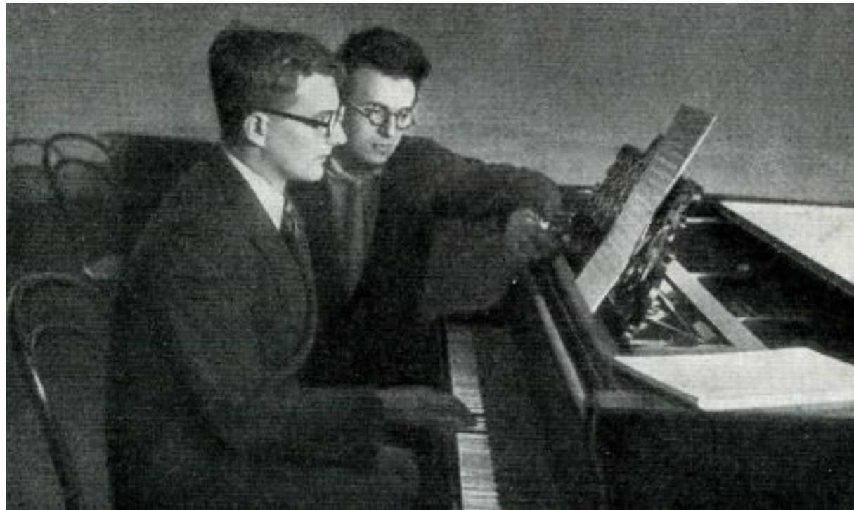
Г. Свиридов и Д. Шостакович

Однако взаимоотношения Свиридова со своим великим учителем были далеко не безоблачными. Он даже бросил консерваторию на последнем курсе, не вернувшись на занятия после разгрома, который Шостакович учинил его шести песням на слова А. Прокофьева. Общение между композиторами возобновилось только несколько лет спустя.