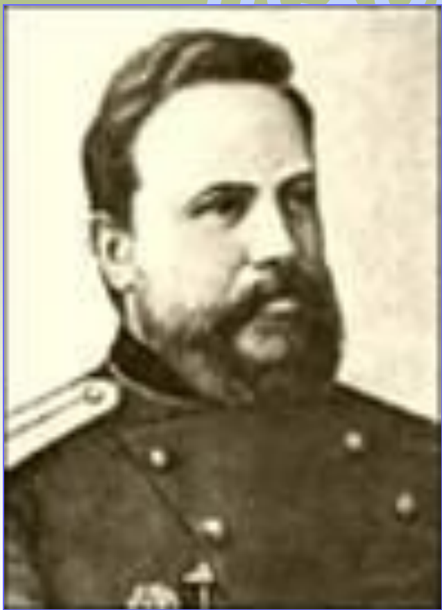
С. И. Мосин