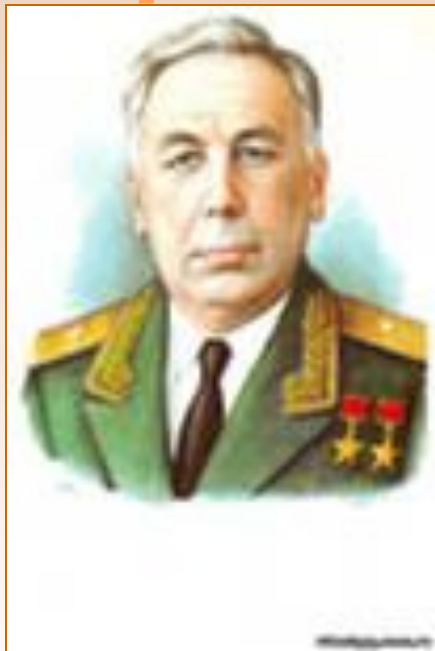
Семен Алексеевич Лавочкин