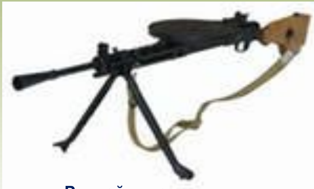
Ручной пулемет Дегтярева